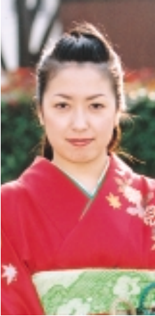
福永飛鳥(おかの台)

編集・発行 / 水巻町役場企画課広報広聴係 〒807 8501 福岡県遠賀郡水巻町頃末北一丁目1番1号 ☎(093) 201 4321