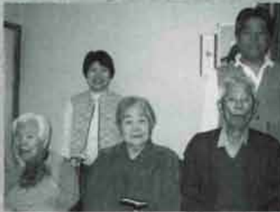
5月7日に行われた表彰式後の記念撮影