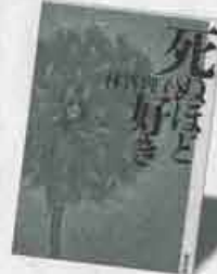
第4位 死ぬほど好き