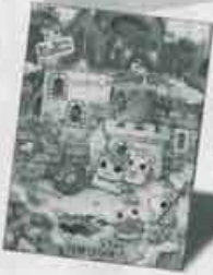
第3位 とつとつハム太郎 ハムちゃんずでございまちゅ