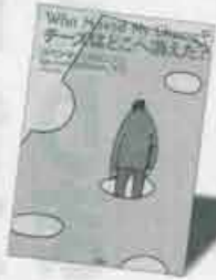
第5位 チーズはどこへ消えた?