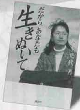
第1位 だから、あなたも生きてぬいて