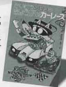
第1位 かいつソロリのきょうふのカーレス