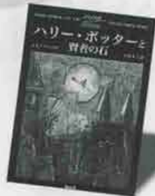
第2位 ハリー・ポッターと 賢者の石