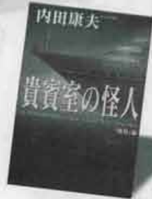
第2位 貴賓室の怪人「飛鷹」編