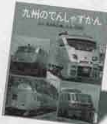
第4位 九州のでんしゃかん