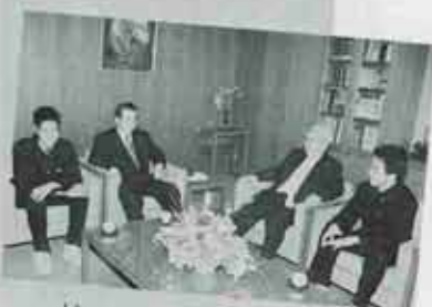
おつかれさまでした。

●議長 これからは、やはり「ひとづくり」だと思います。そこに住んでいる人たちの心と心のふれあいができ、「住んでよかつくりが大切です。みんなと一緒に頑張りましょう。」