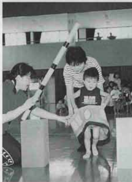
親子ふれあい運動会 カメラに競技に大活躍のお母さん

9月13日、町民体育館で、子育て支援センターの「親子ふれあい運動会」が行われ、元気な子どもと一緒にお母さんやお父さんなど110人が参加しました。いつもの子育て支援センターとは違う広い体育館に子どもたちは大喜びです。「あ・い・う・え」のリズムに乗ってみんな元気に準備体操を始めます。競技は、全部親子で参加するもので、子どもの大好きなドラえもんや新幹線などが出てきます。