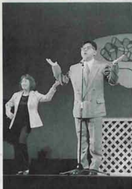
親子ふれあいコンサート