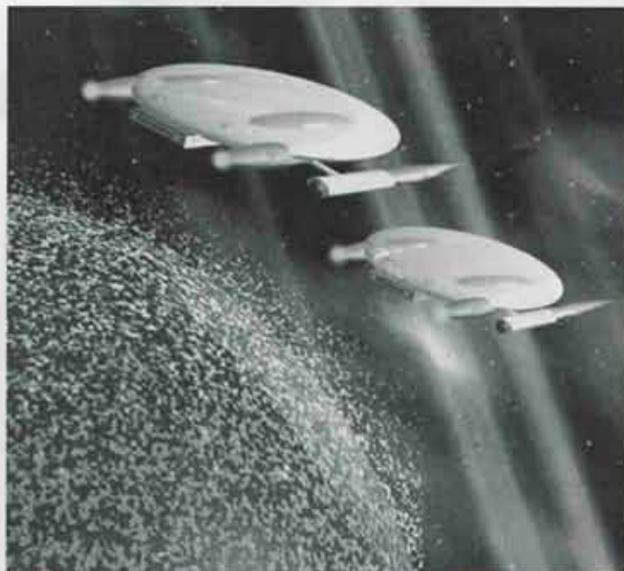
宇宙旅行にも簡単にいける時代がくるのかなあ？