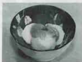
里いものゆずみそかけ