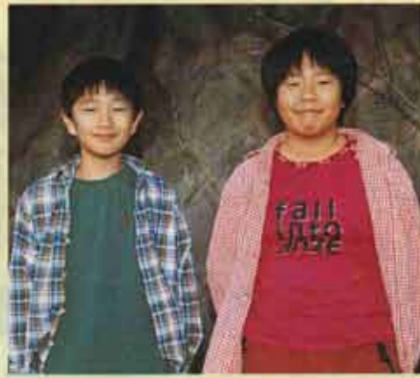
今年も元気にがんばります 二人そろって年女・年男

12月17日、吉田団地の皆さんが地区の公民館横でもちつきを行いました。あいにくの天候で肌寒い1日でしたが、一生懸命にもちをつく子どもたちは、熱気ムンムンです。もちつきが終わると、参加者たちは、豚汁をほおばり、ピンゴ大会を楽しむなど少し早い正月気分を味わっていました。 また、つきたてのもちの一部は、水巻松快園のおじいちゃんやおばあちゃんたちにプレゼントされました。