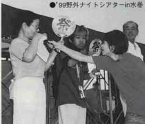
●'99野外ナイトシアターin水巻

議長 繰り返しますが、今年は一〇〇〇年ということで一つの時代の節目です。町制60周年を迎えた水巻町が21世紀に向けて脱皮する、というイベントになればいいなと思っっているんです。ですから、お二人にも大いに参加していただいて、水巻町に住んでよかったと感じてもらいたいですね。 やはり、こうした催しに参加することによってこの町に住んでよかったという実感がわくと思うんです。行政としてもそうした機会を増やさなくちゃ