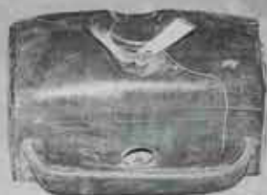
名称 陶製の湯たんぽ

中に入れたお湯の熱を利用する暖房器具。やがて電気あんかが登場すると姿を消していった。楕円形のブリキ製のものがよく知られているが、写真の湯たんぽは陶器でできている。