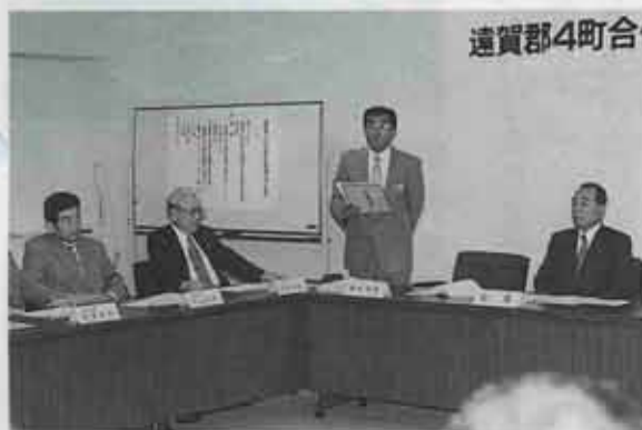
●第1回の合併任意協議会の様子