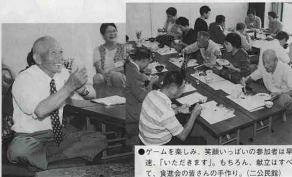
●ゲームを楽しみ、笑顔いっぱいの参加者は早速、「いただきます」。もちろん、献立はすべて、食進会の皆さんの手作り。(二公民館)

9月6日、古賀公民館に第三保育所の16人の子どもたちがやってきました。「ふれあい昼食会」OB会に参加するためです。おじいちゃん、おばあちゃんに歌や踊りをプレゼンすると、お返しに、あやとりやお手玉を教えてもらっていました。また、28日には、二公民館でも「ふれあい昼食会」が開かれ、参加者は食事と、歌やクイズ、ゲームなどを大いに楽しみました。