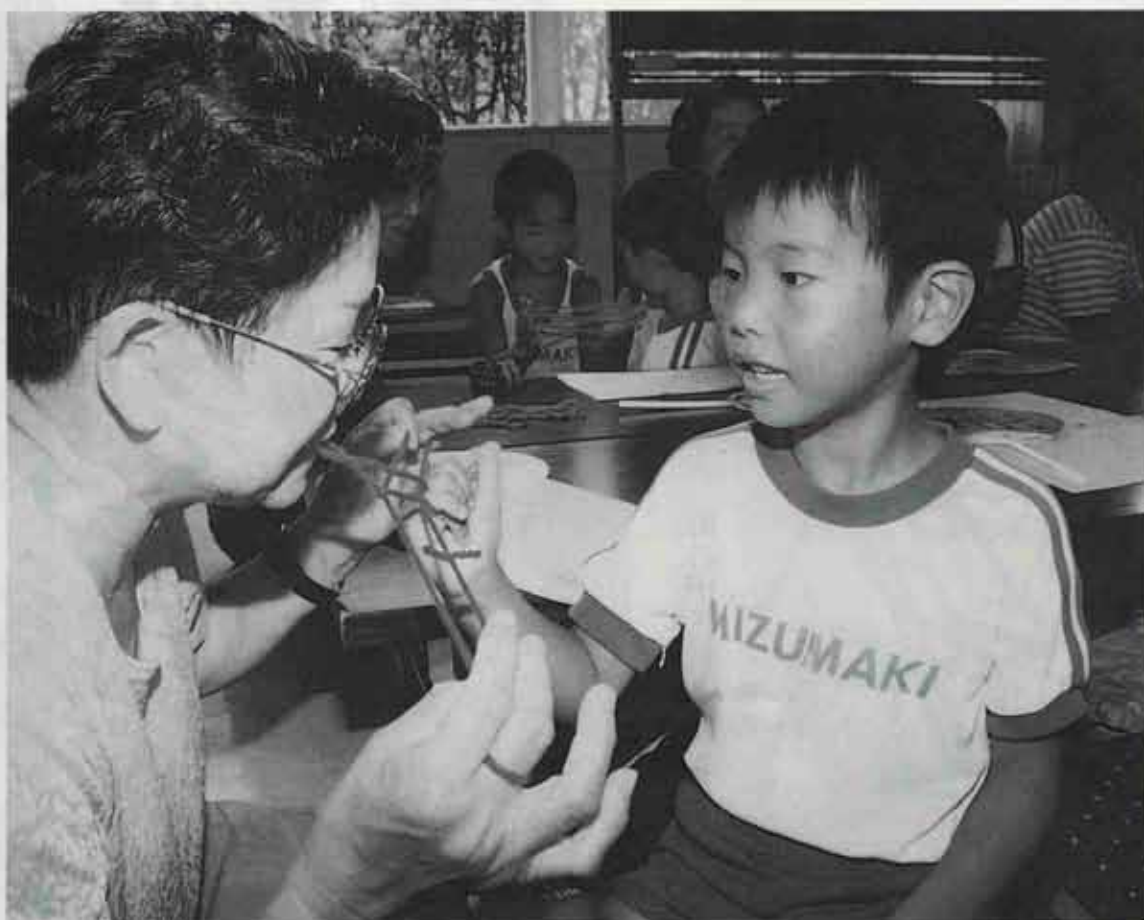
●保育所の園児は、おばあちゃんのあやとりを不思議そうに見つめていました。(古賀公民館)