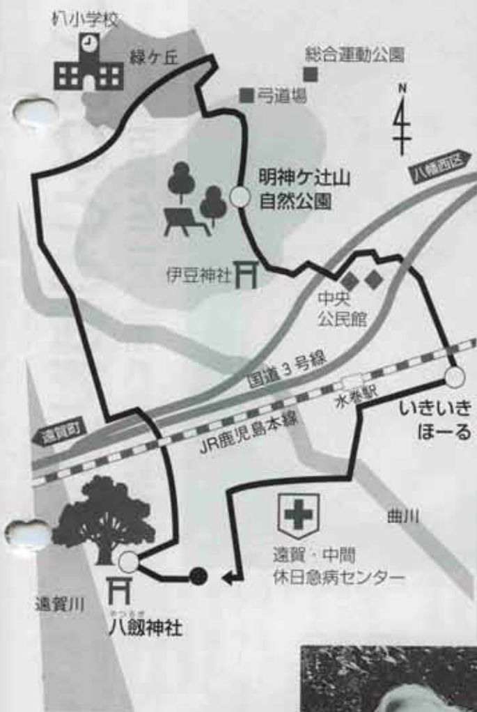
休憩ポイントもたくさん。町の中央部、一まわりコース