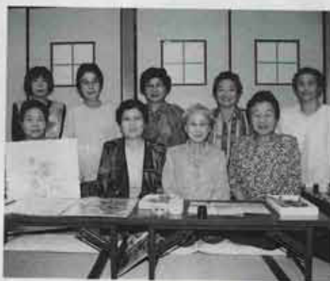
●和紙ちぎり絵の会

この会は、公民館講座をきっかけに発足して12年になります。和紙を使ったちぎり絵の世界。同じ和紙でも、はぎ方によって微妙な濃淡が付くなど、その世界はどんどんふくらんでいるんですよ。また、無理なく長く続けられ、現在、仲の良い17人の会員が、わきあいあいとした雰囲気の中で活動を続けています。今、会員を募集しています。現会員が優しく作品作りのお手伝いをしますので初心者でも心配はいりません。一度、私たちの活動を見に来てみませんか。 ●活動日 毎月第二、四日曜日午前10時～正午 ●ところ 中央公民館 ●会費 月額千五百円 ●連絡先