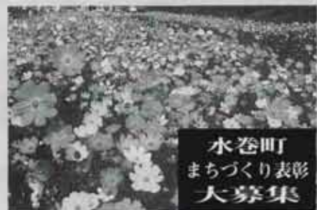
水巻町 まちづくり表彰 大募集

町では、快適環境づくり計画（結の里づくり構想）を進めていくための一環として「水巻町まちづくり表彰事業」を実施しています。