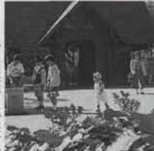
JR九州篠栗線・筑豊本線