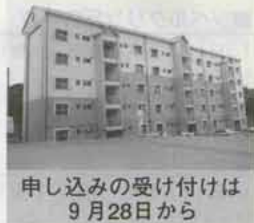
申し込みの受け付けは 9月28日から