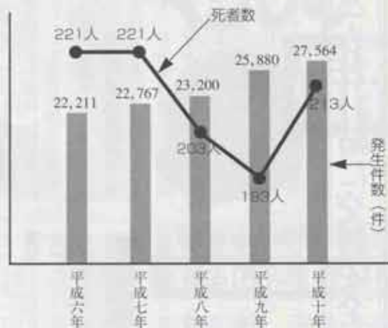
図2 ●違反別死者数 (平成10年1~7月)