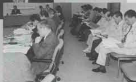
●熱心に説明を聞く参加者たち。