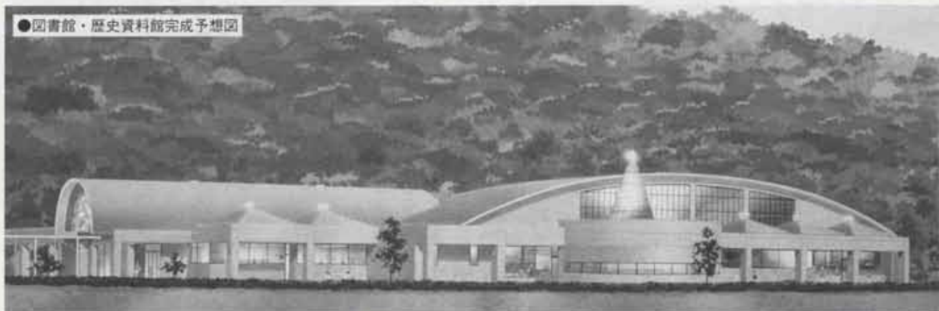
●図書館・歴史資料館完成予想図

て自主的な活動を展開し、町を活性化させていくことが大切です。総合的な人格を備えた人材を育成するためには、学習の場を提供し、生涯を通じた学習を推進することが必要なのです。