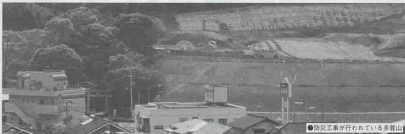
● 防災工事が行われている多賀山

よく「まちづくりは人づくり」と言われます。水巻町で生まれ育った人々が豊かな創造力を養い、コミュニケーションを通し