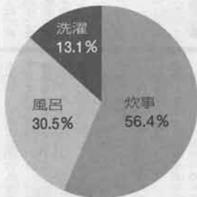
生活排水中の汚濁原因・BOD

平成8年の遠賀川の水質は、汚れの順位が九州ワースト1でした。その原因の8割以上が家庭から出る生活排水です。私たちのふるさとの川を再び、健康で美しい川にするためには、それぞれの家庭で水の捨て方を改善することがいちばんの近道なのです。