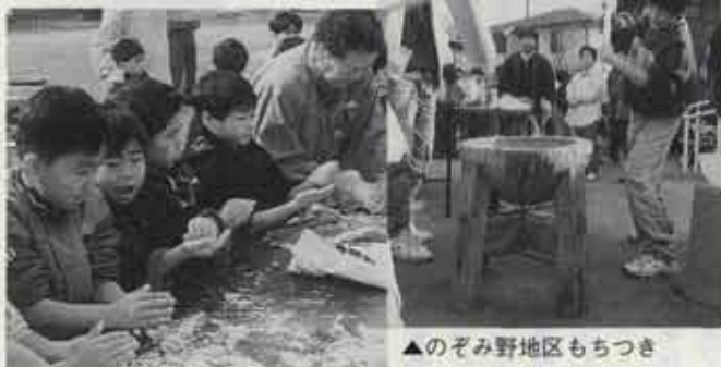
▲のぞみ野地区もちつき