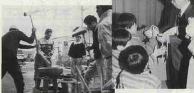
●いきいきほーる年末お楽しみ会