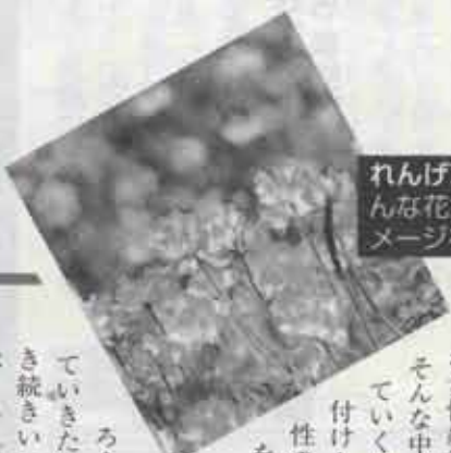
れんげ草●会の名称のれんげ草は、小さくかわいい花が大地に群生し、肥よくな土壌を作るイメージを重ね名付けられました。