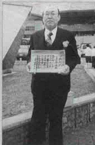
九州地区体育指導委員功労者表彰