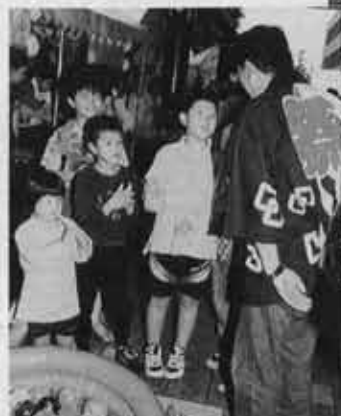
▶今年の5月に行われた「ふれあいフェスタ95」