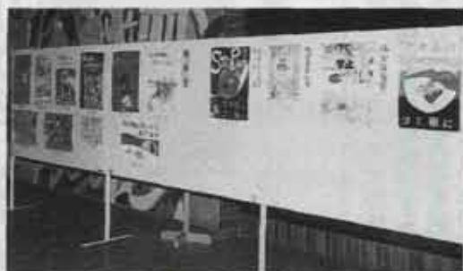
▲入選作品は9月18日まで役場正面玄関に展示しています。

ポイ捨てゴミから町を守りたい。 その願いがこめられたポスター の入選作品が決まりました。