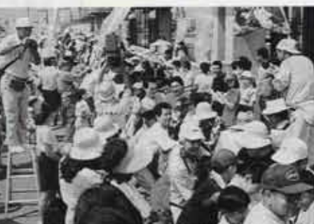
▲平成6年9月に行われた「遠賀川大綱引き大会」

では、水巻、芦屋両町の住民約三千人が、力を競い合いました。観衆も約一万二千人にのぼり、それぞれの町の交流を深める意味で価値のあるものだったと思います。今年の大綱引き大会は、9月17日に行う予定です。皆さんもぜひ参加してください。 これからも、水巻町にふさわしい「ふるさとの祭り」を作りたいと思いますので、皆さんにも積極的に参加して欲しいと思います。