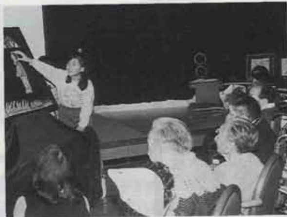
▲少年少女ボランティアサークル