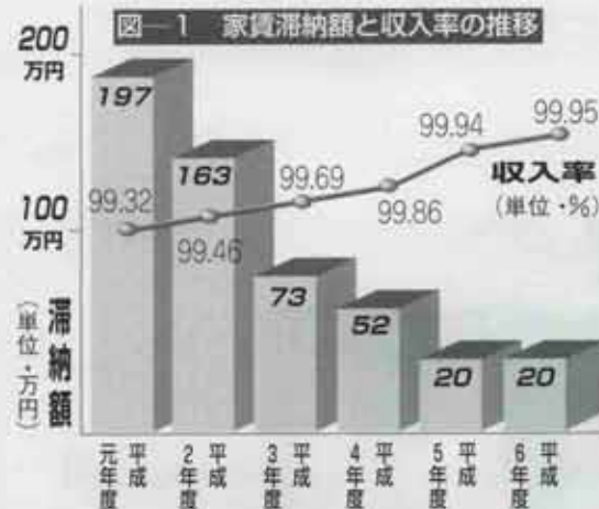
表-1 滞納月数別滞納戸数の内訳

町の家賃滞納対策が本格的に始まったのは昭和61年度からです。当時の家賃滞納額は約三千六百万円。滞納者は二百人を超えており、中には百万円を超える高額滞納者もいました。町は滞納者を減らすため、徴収嘱託員を採用し、契約書の更新を徹底。さらに職員による夜間徴収を開始しました。また悪質滞納者には裁判を行い、広報にもPR記事を連載しました。その結果、三年後には滞納家賃が三百四十五万円へと大幅に減少しました。水巻町における家賃滞納対