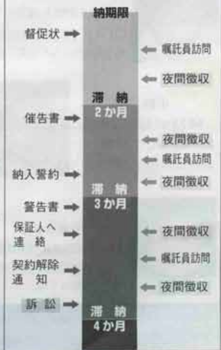
図-2 家賃滞納対策のながれ

再三の催告にもかかわらず、家賃の滞納が3か月分になった場合は、納入期限を指定した警告書を送付し、連帯保証人に滞納額を支払います。それでも期限までに支払いがなく、納入の相談もない場合は、内容証明郵便で契約解除の通知を行い、裁判所に対して家賃明け渡しの訴訟を提起しています。平成6年度は、家賃明け渡しの訴訟を4件行いました。いずれも納入誓約を守らず、町との信頼関係がなくなったケースでした。