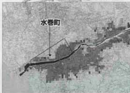
資料提供：建設省遠賀川工事事務所