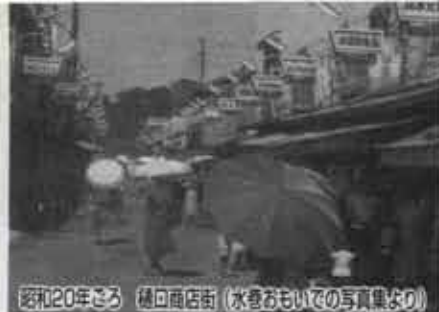
昭和20年ごろ 樋口商店街（水巻おもいでの写真集より）

炭坑の開発によって、たくさん集落が発展していきました。三好炭坑の時期までは、大納屋と小納屋が坑口の周辺に点在していました。日本炭坑圏に経営が移され、計画的な宅地開発が進められるようになり、そのほとんどは、昭和九年から着手されはじめ、事業の拡大によって増設され、昭和二十三年の中央区社宅（頃末）の建設によって一応終了します。三好鉱業が高松炭坑を主軸としていただけに、その集落は明治時代から