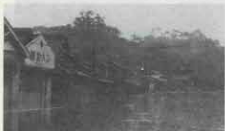
昭和28年 河守神社付近

この日、遠賀川は前日からの降雨で増水しており、緊迫した雰囲気の中、水巻町からは41人の水防団員が参加。近隣の水防団員や消防関係者、自衛隊員とともに日ごろの訓練を生かし、きびきびとした動作で土のう積み、「くいごしらえ」などの準備作業や堤防崩壊を防ぐ水防マット工法などの訓練を行いました。