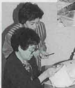
「フランス刺しゅう」