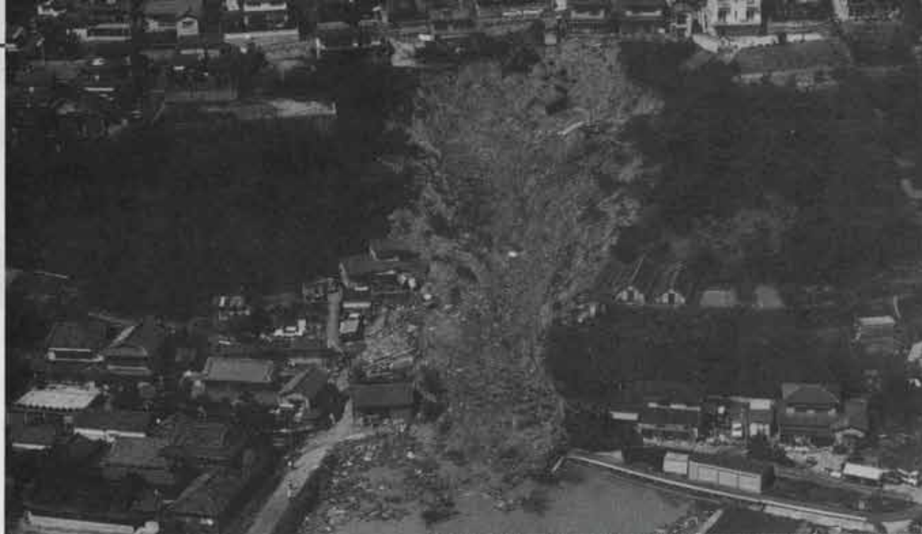
台風によるがけ崩れ災害（岡山市小幸田地区、1990年9月、台風19号）