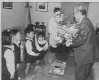
水巻幼稚園の園児たちが 役場を訪ね

5月8日、水巻幼稚園の園児が町長に花のプレゼント。これは日ごろ、お世話になっている病院や郵便局などに毎年贈っているものです。花束に添えられた手作りのカードには「いつも私たちのためにありがとうございます。これからも体に気をつけて頑張ってください」とがわい文字で書かれていました。