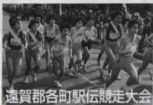
遠賀郡各町駅伝競走大会

2月5日、遠賀町総合運動公園で行われました大会には、小学生から成人まで314人が参加し、健脚を競いました。町内からは75人が参加。駅伝では小学生、中学生、一般の各部で16人が区間賞に、小学生のマラソンでも17人が入賞するなど、各種目で大活躍しました。