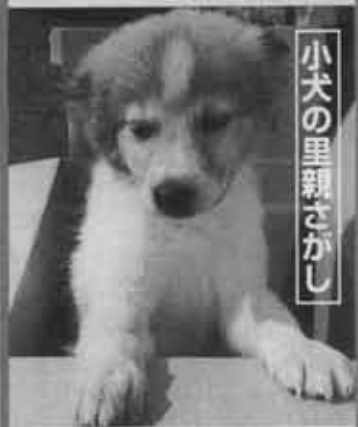
小犬の里親さがし

県内では、毎年約1万8500頭の犬が処分されています。そのため、県では「子犬の里親さがし」を実施しています。3月29日、遠賀保健所での「出張里親さがし」が行われます。また、当日は獣医師による飼育相談なども行われます。小さな命に、あなたの愛情を分けてください。