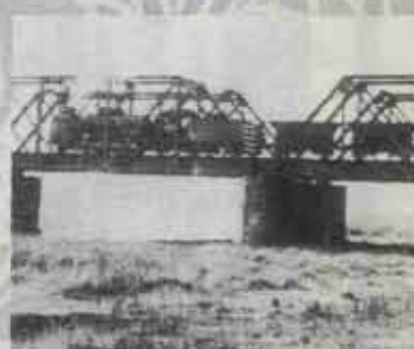
遠賀川の鉄橋、石炭列車(町勢要覧より)