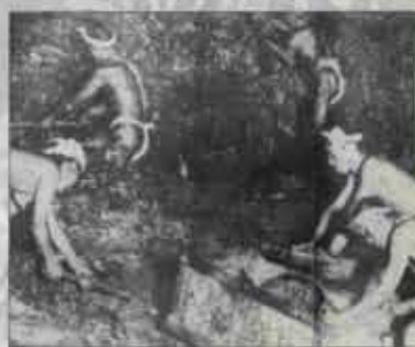
坑内採炭作業風景(町勢要覧より)

また、炭坑は村人たちに大きな影響を及ぼしました。新しく炭坑を手がけようとする人や日備で現金収入を喜ぶ人、坑夫を相手に小売が繁盛する人などが出てくるに連れ、農村に恵をもたらすようになり、坑夫の中には粗暴な人もいて、言葉遣いや乱暴な立ち振る舞いに目をそむけることも多かつたようです。このほかにも、魚を捕るために畦道を踏み荒らして稲をそこねたり、野菜や果物を盗まれたりすることも頻りにあつたようです。明治二十年ころ風紀問題について村から炭鉱側に要求した文書が残されていることなどからも、当時の村人たちの苦悩を知ることができます。