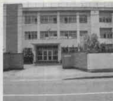
現在の水巻南中学校

し、その校区である私立小学校は激増する生徒の収容ができなくなり、昭和二十九年、新しく猪熊に分教場を設け、梅ノ木、高松、五礮区、樋口町、猪熊の児童を収容します。そして、昭和三十一年には猪熊小学校として独立し、北部の通学はこれで緩和されることになったのです。