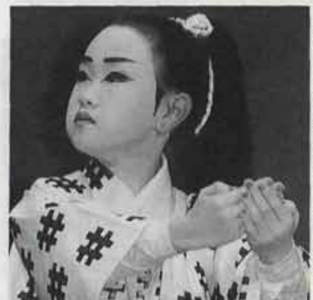
きりっとした表情で演じる晴れ舞台