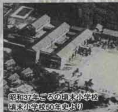
昭和37年ごろの頃末小学校 頃末小学校50年史より

明治19年、制度の改正により、小学校の課程が尋常科4か年、高等科4か年に改められてからは、尋常科4か年を義務教育期間とし、高等科のほか、土地の状況では三年制の小学簡易科を設けることが許されました。これにより遠賀郡の高等科は芦屋一か所だけに置かれることになりました。そのため、高等科を志望する生徒の通学は容易でなかったようです。そ