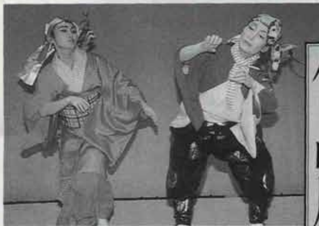
息のあった微笑しい踊りに会場からは大きな拍手