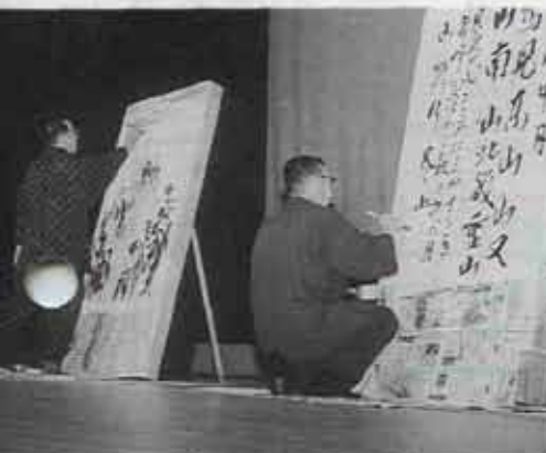
詩吟に合わせた見事な筆づかい