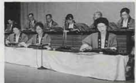
美しいメロディーの大正琴