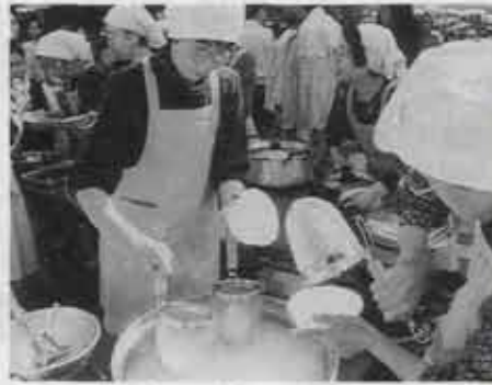
人気の食進会のバザー。裏舞台は大忙し。