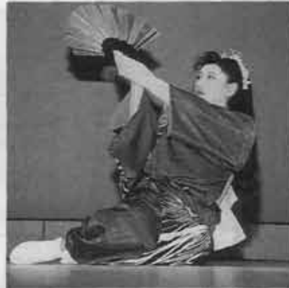
あでやかな舞についうっとり