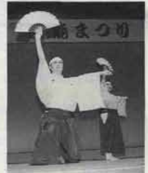
決めのポーズもピタリ