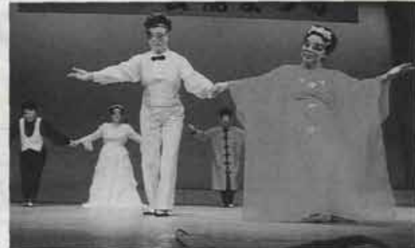
仮面をつけ華やかなダンスを披露