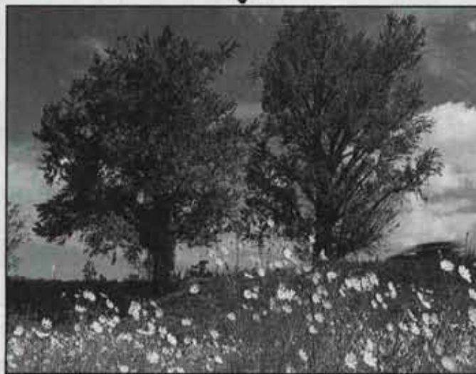
水巻町秋・冬ミニ写真 コンテスト入選作品