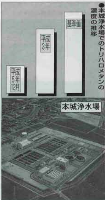
●本城浄水場でのトリハロメタンの濃度の推移

その結果、トリハロメタンの濃度を約20パーセントから30パーセント抑えることができ、塩素の使用量も30パーセント減少させることができました。また、活性炭処理を同時に行うため、吸着量が大きくなり、かび臭も除去できます。このようにして高かったトリハロメタンの数値を抑えることができるようになり、「より安全で、よりおいしい水」が供給できるようになりました。