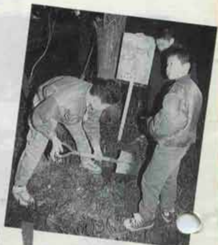
「ゴミはゴミ箱に!」 手作りの立て看板も登場。