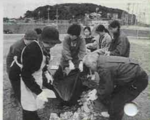
うれしかったのは、地域の 人たちが参加してくれたことです。