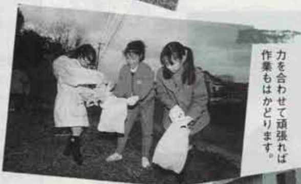
力を合わせて頑張れば 作業もはかどります。