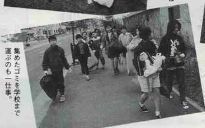
集めたゴミを学校まで 運ぶのも一仕事。