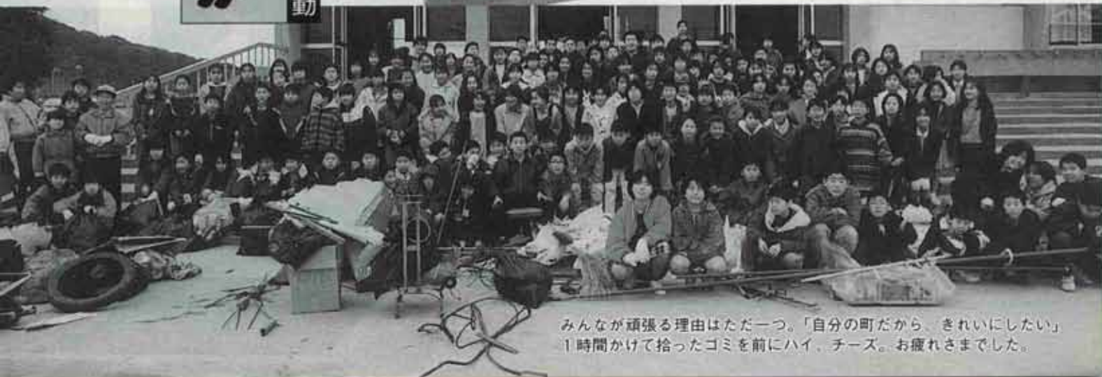
みんなが頑張る理由はただ一つ。「自分の町だから、きれいにしたい」 1時間かけて拾ったゴミを前にハイ、チーズ。お疲れさまでした。