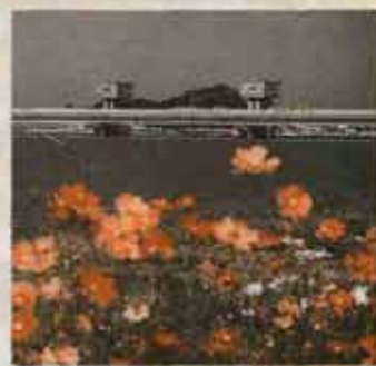
●河川敷から遠賀川を望む