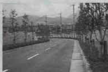
▶ 街路樹(緑ヶ丘) クスノキ百四本