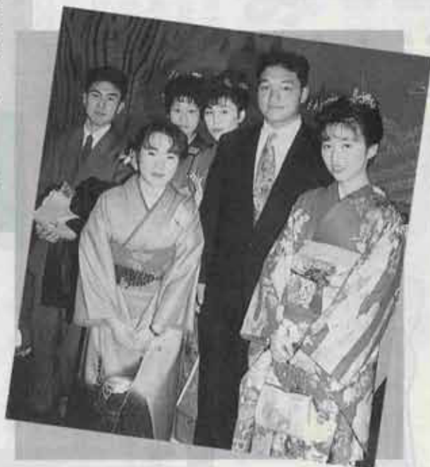
●写真は今年の成人式でのスナップです。

この名簿は11月30日現在の住民票をもとに作成しています。名前が載っていない人、名前に間違いなどある人は、中央公民館（☎201局0401番）までご連絡ください。なお、成人式には就学や就職のため町外に住んでいる人も参加できます。出席を希望する人は申し出てください。