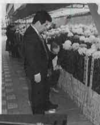
◀ 作品は力作ぞろい。ついつい見とれます