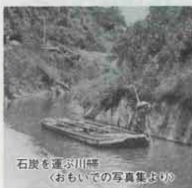
石炭を運ぶ川船

(一七五七)九月五日で「切抜き」は一応、終わりました。しかし、水路としては幅が少し狭く、川幅と呼ばれる輸送船が通ることができなかったため、翌宝暦八年(一七五八)三月から再び拡張工事を行うことになりました。この工事により川幅は二倍の広さとなり、全区間の工事の完了を待つて宝暦一二年(一七六二)に洞海湾まで開通しました。これによって村々の灌漑用水が確保され、年貢米も苜蓿を回らず、若松に直行できました。そのため物資の流通もよくなり、人々の喜びは大きかったことと思われれます。この後、堀川はその重要性により、さらに変ぼうをとけていくことになりました。