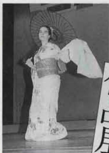
▲ 日本文化に魅せられて… 会場からは大きな声援が飛びます