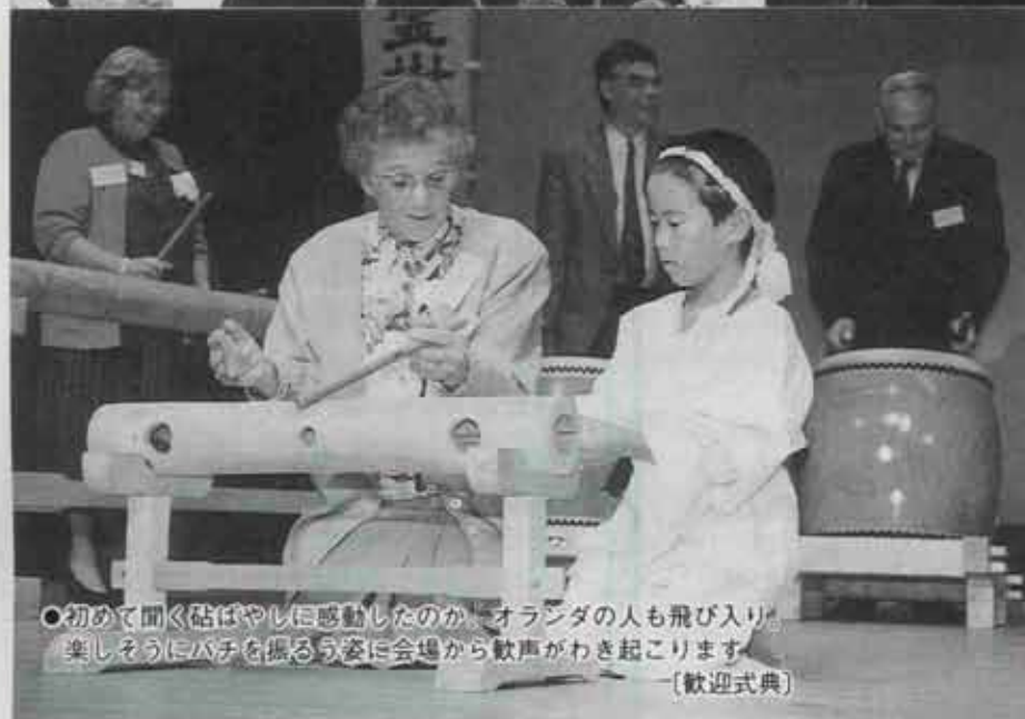
○初めて聞く砦ばやしに感動したのか、オランダの人も飛び入り 楽しそうにバチを振るう姿に会場から歓声がわき起こります [歓迎式典]