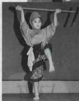
▲ とにかく一生懸命に 踊りました