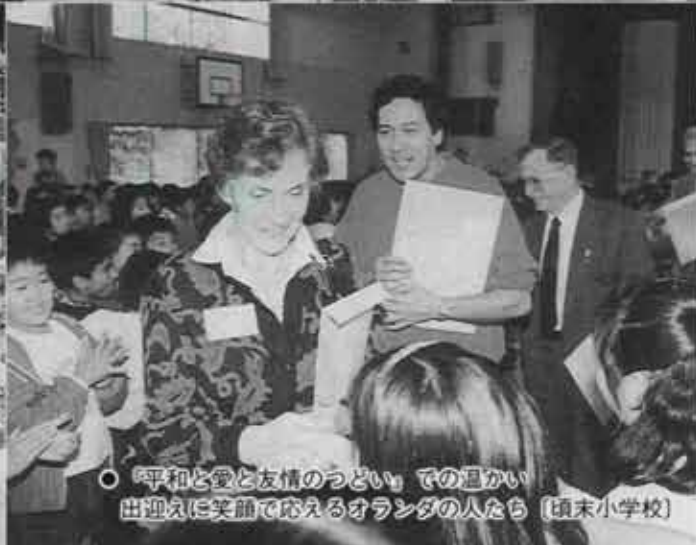
○『平和と愛と友情のつどい』での温かい 出迎えに笑顔で応えるオランダの人たち [碩末小学校]