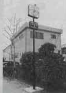
▶ 太陽電池時計(吉田)

東水巻駅入口 (県道側)には若 松法人会からの 贈られた太陽電 池時計。通勤通 学にとっても便 利です。