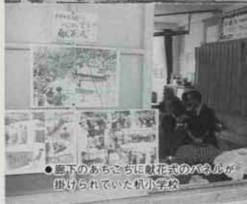
●廊下のあちこちに献花式のパネルが 掛けられていた机小学校