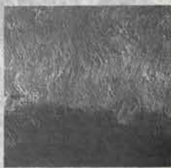
●当時の苦勞をしのばせるノミの跡

(一七五七)九月五日で「切抜き」は一応、終わりました。しかし、水路としては幅が少し狭く、川幅と呼ばれる輸送船が通ることができなかったため、翌宝暦八年(一七五八)三月から再び拡張工事を行うことになりました。この工事により川幅は二倍の広さとなり、全区間の工事の完了を待つて宝暦一二年(一七六二)に洞海湾まで開通しました。これによって村々の灌漑用水が確保され、年貢米も苜蓿を回らず、若松に直行できました。そのため物資の流通もよくなり、人々の喜びは大きかったことと思われれます。この後、堀川はその重要性により、さらに変ぼうをとけていくことになりました。