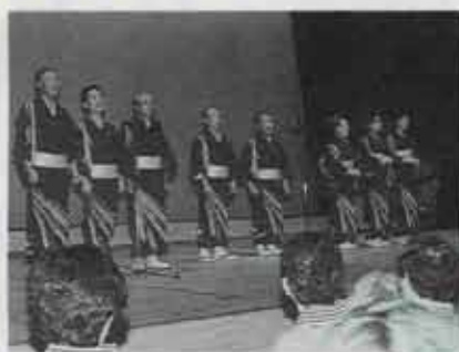
▶ 迫力の歌声、高らかに