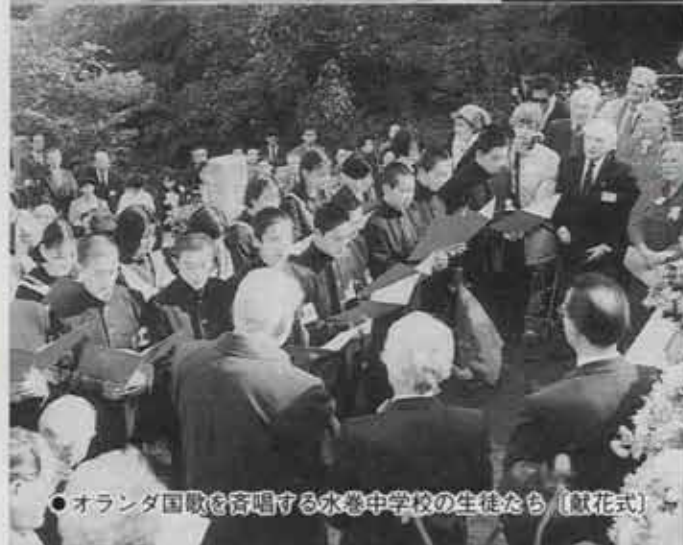
●オランダ国歌を斉唱する水巻中学校の生徒たち [献花式]