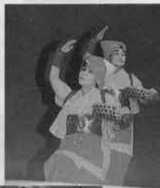
▲ 決めのポーズもはつちりと