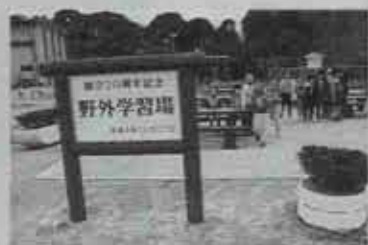
◀ 野外学習場(吉田小学校)