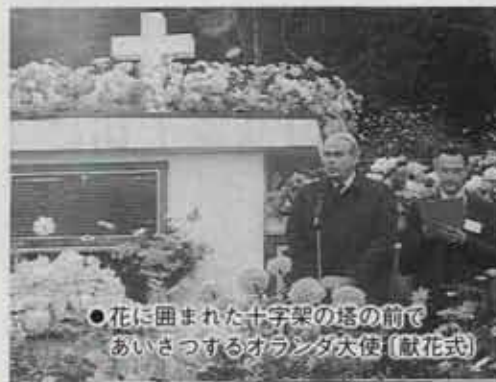
●花に囲まれた十字架の塔の前で あいさつするオランダ大使 [献花式]

○何を思い、遠くを見つめているのか。 時代を越え、国境も越えた平和への祈り [献花式]