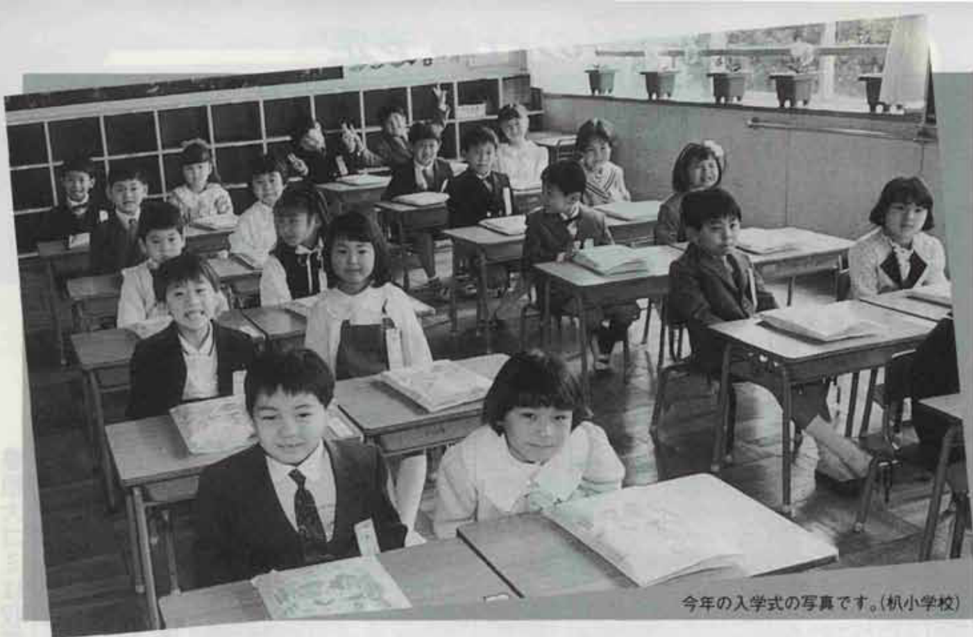
今年の入学式の写真です。(机小学校)