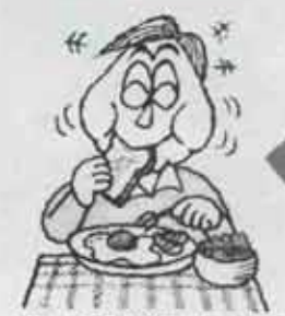
ともかく何かおなかに入れて