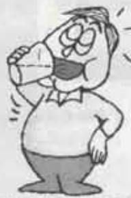
起きがけの1杯の水