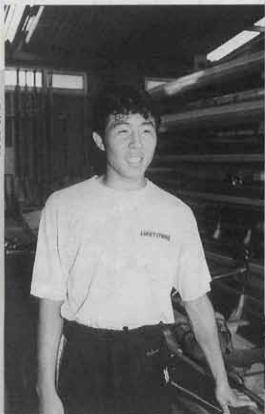
8月2日から埼玉県戸田市で開催の高校総体に漕艇「かじなしフォア」の部で出場。