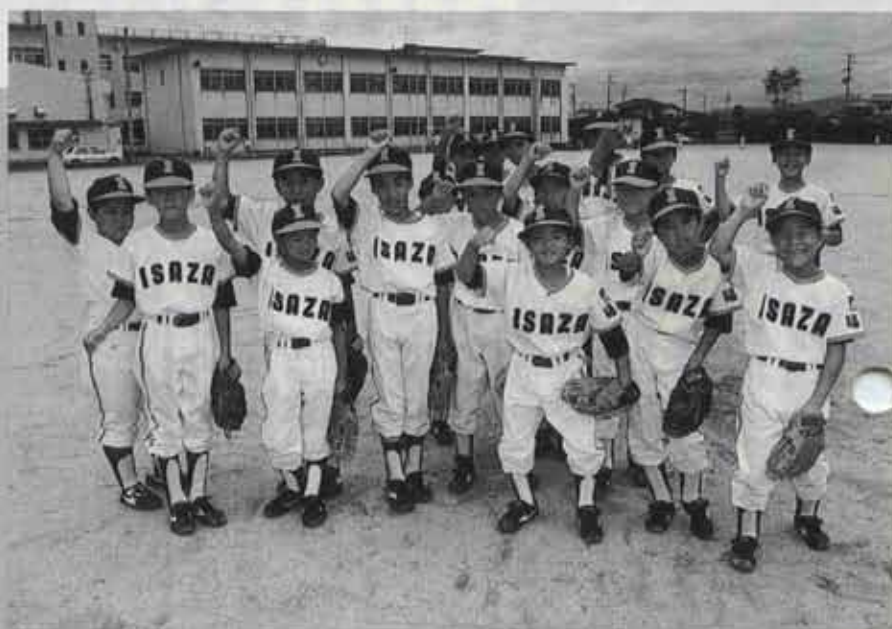
8月26日から福岡市で行われるスポーツ少年団軟式野球九州大会に出場。