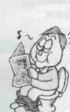
感じなくても毎日座ってみる

⑥排便反射は、脳に便意を引き起こさせ、直腸を収縮させる ⑦軽く力むと、肛門の筋肉が開いて便がでる ところが、人は大人になると排便反射を抑えたり、便意を無視することを覚えます。 とりあえず便秘対策で大切なことは、排便反射を無視しないことです。排便反射の弱い人は、朝起きたら水を飲んで腸を刺激するこ