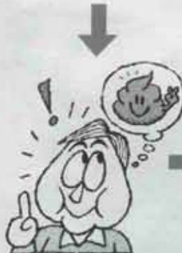
感じたら無視しないで