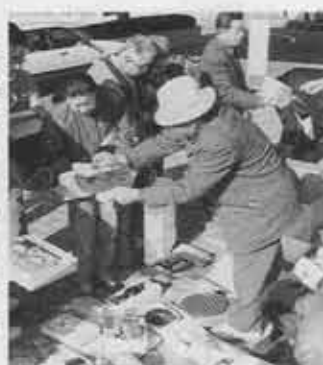
リサイクル連絡会

公衆衛生審議会伝染病予防部会では、新三種混合ワクチン接種後の無菌性髄膜炎の副作用発生頻度が高いため、新三種混合ワクチンの各医療機関の窓口接種は、しばらく中止することになりました。なお「はしか」のみの予防接種は従来どおり窓口で行っています。