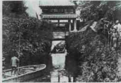
1804年に建造された寿命の水門