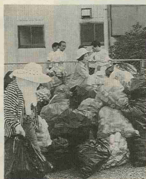
当日は各世帯一名の参加をお願いします。

水巻町地区衛生推進協議会では12月6日(日)午前8時から10時まで町内全域で空きかん・空きびんの回収運動を行います。