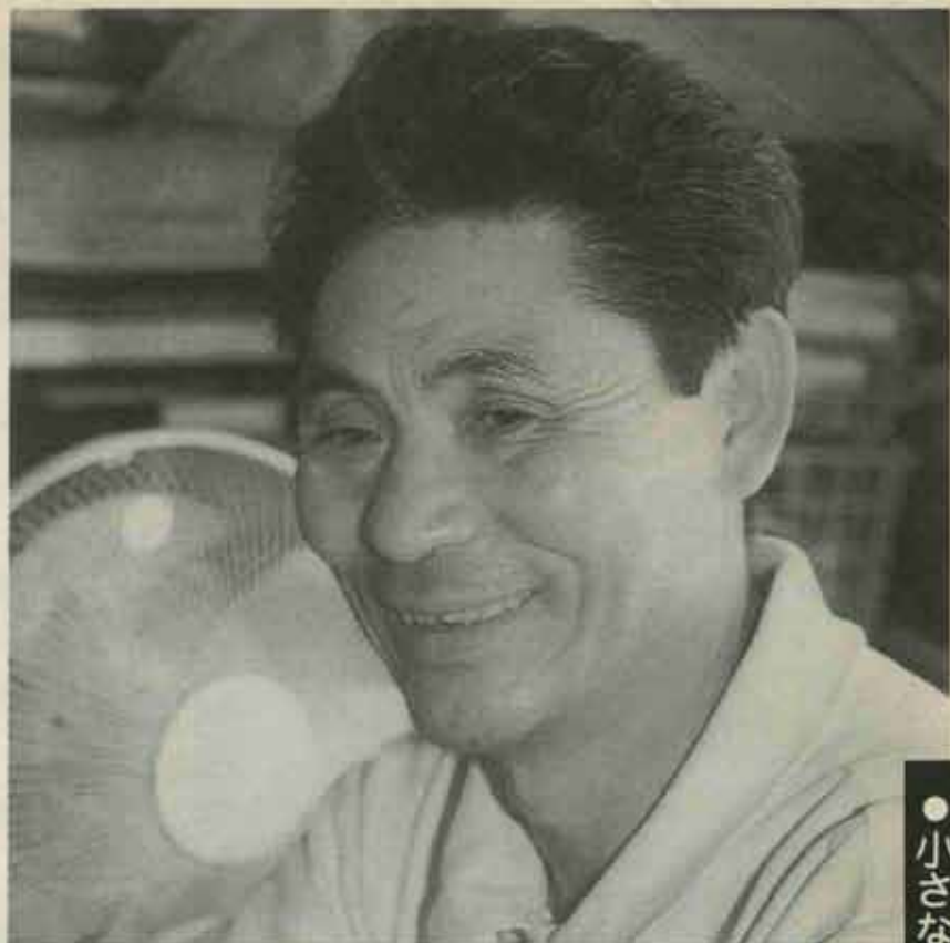
●小さなケガは、大きなケガを防ぐ

「道具を使って物を作るなかで、子供たちはやはり小さなケガをします。でも、少しくらい小さなケガをさせてやるのが、大きなケガを防ぐことになりま