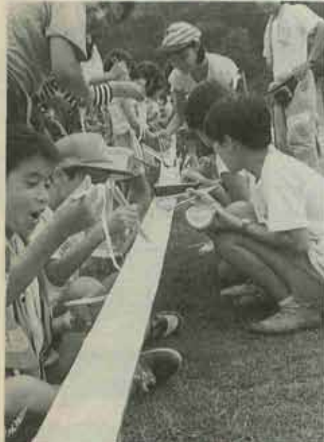
キャンパスの締めくくりは「ソーめん流し」