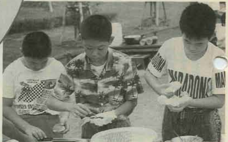
ボクたちは、ちょっと味にはうるさいんです。