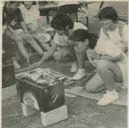
味の決め手は火加減です。

来年、また参加します 食事の準備では、私は火の番をしていたので、調理は友達に全部任せていました。外でみんな食べるのは、とてもおいしかったです。来年は必ず宿題を終わらせてから参加します。