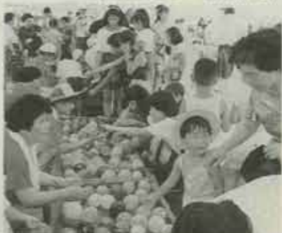
② 今年で2回目の水巻葉月まつり。ユニート前は大にぎわいです。(7/24)