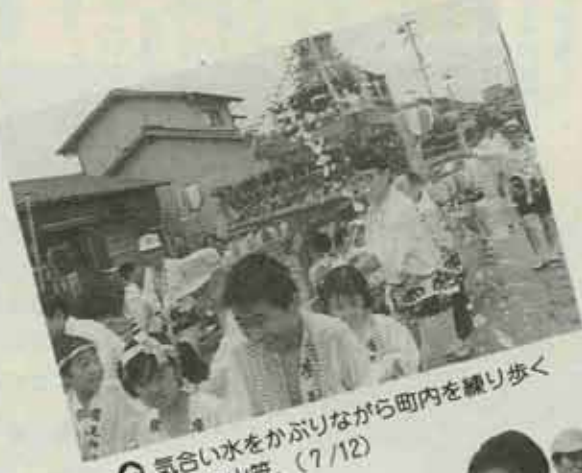
① 気合い水をかぶりながら町内を練り歩く猪熊の山笠。(7/12)