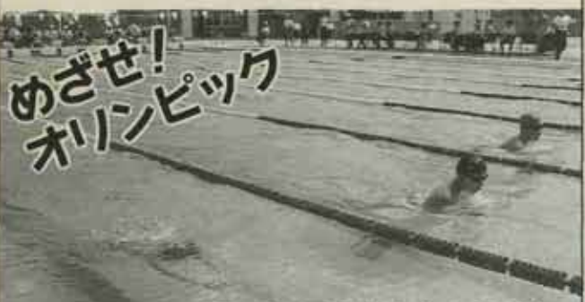
●郡民体育大会水泳競技

夏を待っていたかのように7月5日のスポーツ少年団水泳大会に続き、7月19日に第33回郡民体育大会水泳競技が町民プールで開かれました。結果は、総合の部で準優勝の成績を取めたほか、個人でも郡大会新記録三つを含む12の種目で優勝しました。