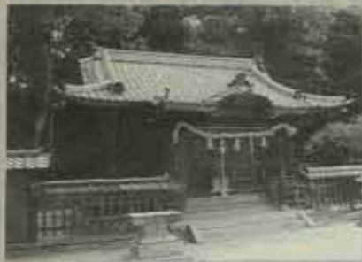
●堀川の歴史を 静かに見つめてきた 河守神社