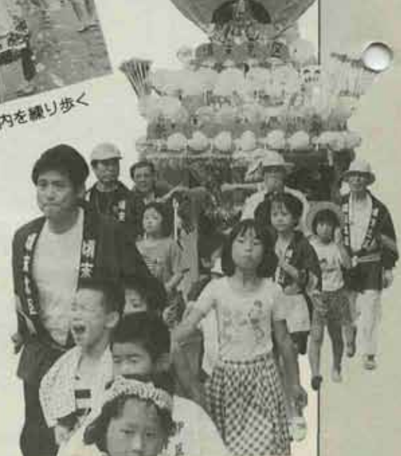
③ 毎年ユニークな山笠が登場する頃末の夏越祭。(7/18)

④ この日はかりは無礼講。ハッピ姿の女性たちが御興をかついで団地の中を駆け抜けます。(7/26)