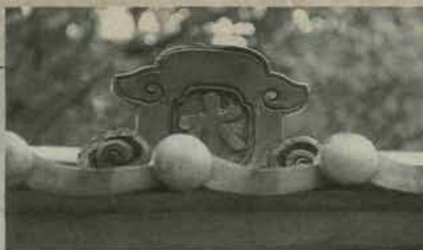
●水の守り神を 象徴する 河守神社の 鬼瓦