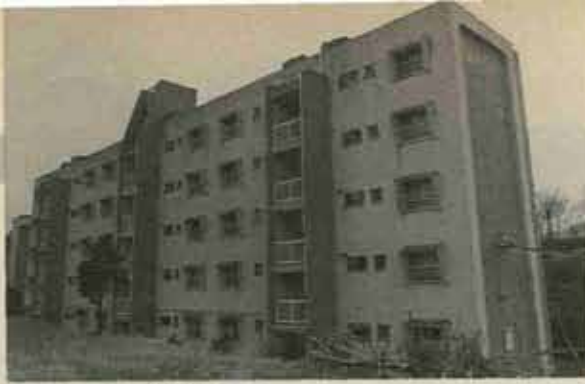
④ 着工前（高松団地4棟）