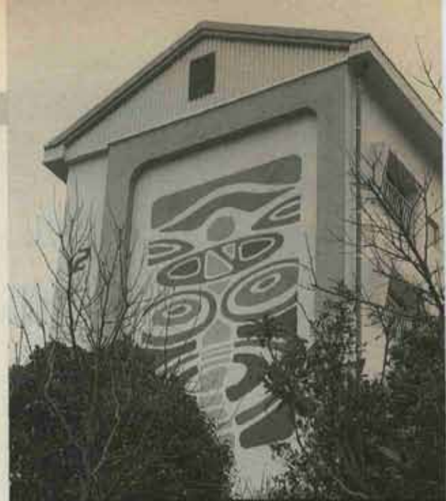
⑥ たて7.2メートル・よこ4メートルの巨大な壁面レリーフがひとときを見立ちます