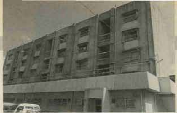
① 着工前 (吉田団地58棟)