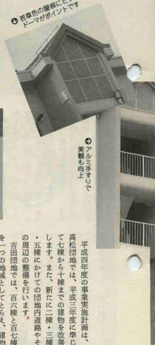
④ アルミ手すりでも美観も向上