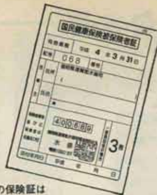
この保険証は切り替えです。