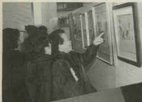
◎ホールや廊下は展示作品がスラリ。