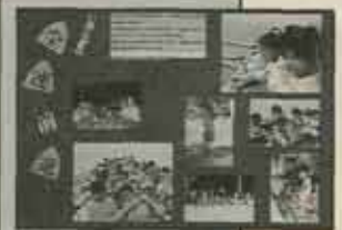
平成3年度福岡県広報 コンクール・相写真の部 で広報みずまきが特選