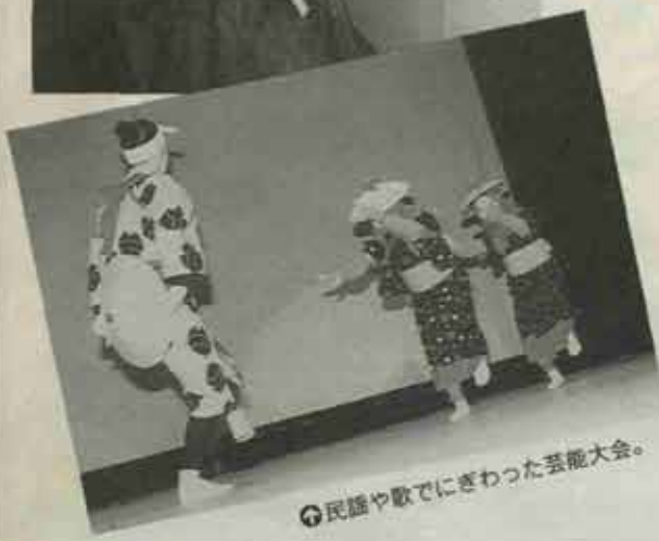
◎民謡や歌でにぎわった芸能大会。