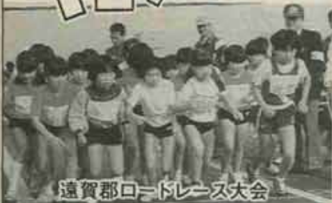
遠賀郡ロードレース大会