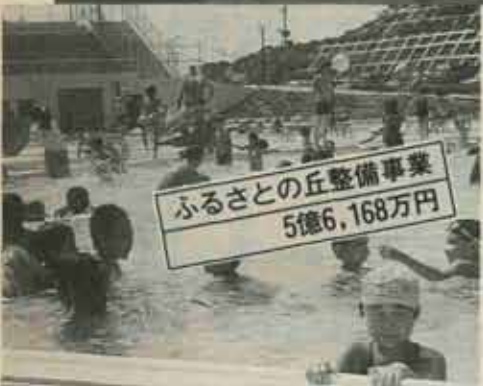
ふるさとの丘整備事業 5億6,168万円