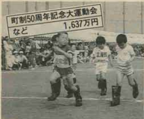
町制50周年記念大運動会 など 1,637万円