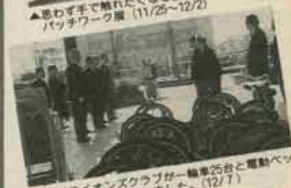
▲本郷ライオンズクラブが、一輪車25台と電動ベクト2台を町に寄贈しました。（12/7）