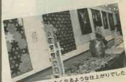
▲思わず手で触れなくなるような仕上げができた。バッチワーク展（11/25～12/2）