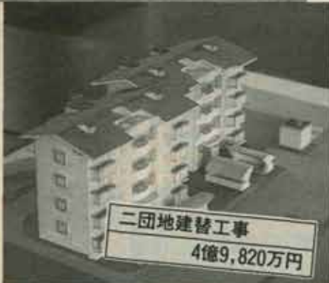
二団地建替工事 4億9,820万円