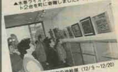
▲アマチュア画家の油絵展（12/9～12/20）