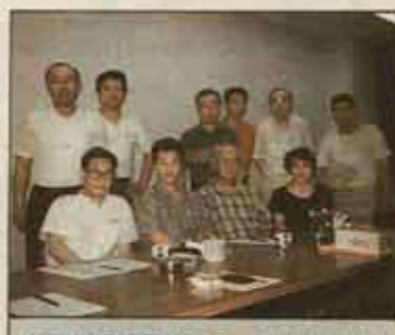
体育指導委員はユニークさが売り物