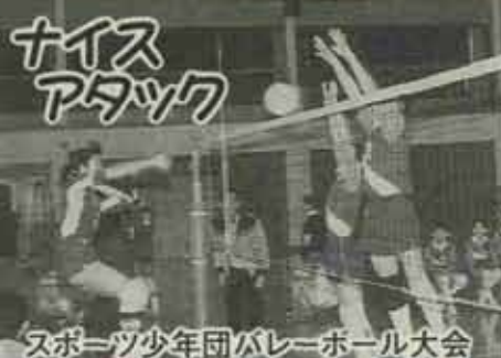
スポーツ少年団バレーボール大会

12月8日、芦屋町総合体育館で行われた遠賀郡バレーボール選手権大会には、男女20チームが参加しました。接戦の末男子は水巻クラブが優勝、女子Aパートは水巻南が2位の成績をおさめました。