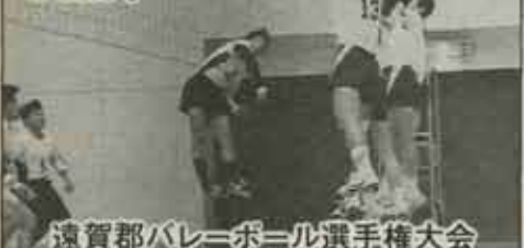
遠賀郡バレーボール選手権大会