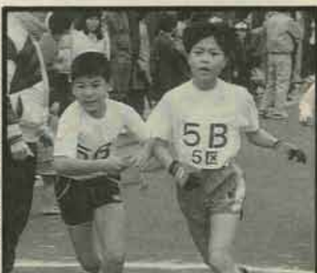
遠賀郡各町対抗駅伝競争大会