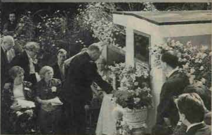
⑤ コスモ스에囲まれた十字架の塔で、しめやかに献花式が行われた。

戦時中、旧日本軍の捕虜となり、炭鉱などで亡くなったオランダ人兵士を慰霊する献花式が、10月20日十字架の塔でありました。