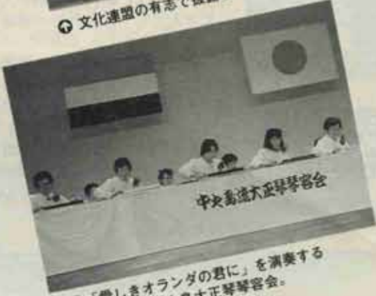
◎ 「愛しきオランダの君に」を演奏する大正琴の中之島大正琴客会。