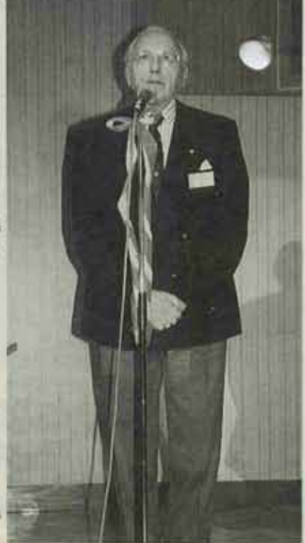
◎ 歓迎のお礼を述べるウインクラールさん。