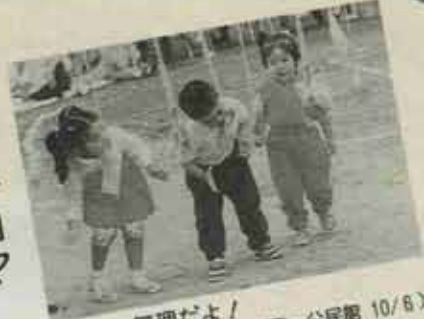
口じゃ無理だよ! (吉田一公民館 10/8)