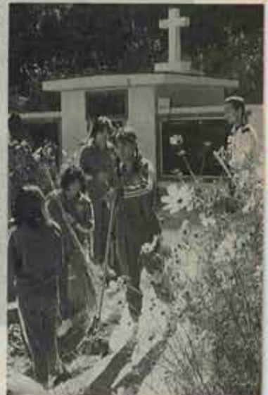
⑥ 十字架の塔周辺を清掃する水巻中の生徒たち。(10/18)