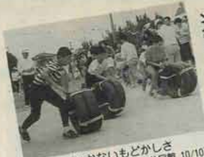
まっすくいかないもどかしさ (二公民館 10/10)