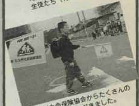
北九州生命保険協会からたくさん交通安全旗をいただきました。