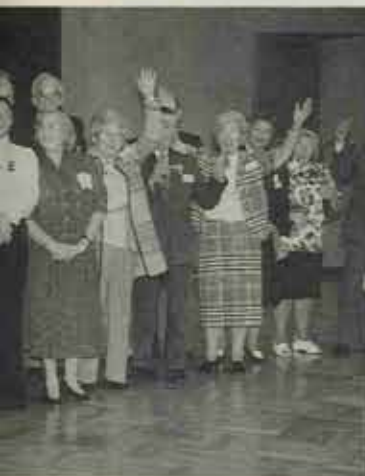
② 歓迎に笑顔で応えるオランダ人一行22人。