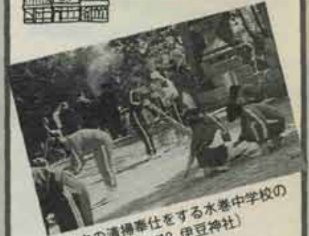
町内の清掃奉仕をする水巻中学校の生徒たち (10/18 伊豆神社)