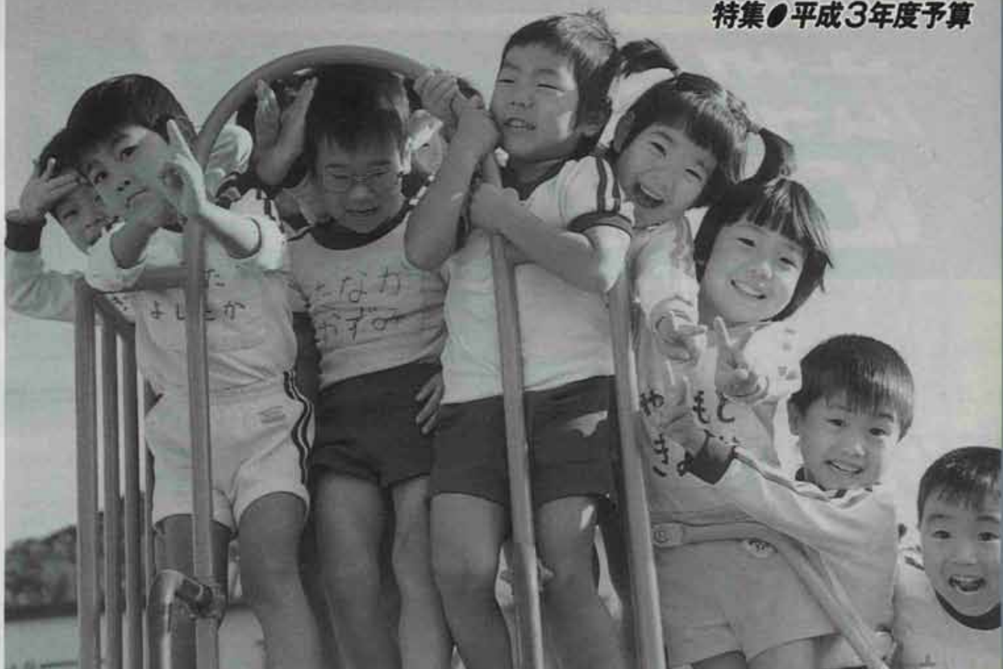
●写真は吉田保育園