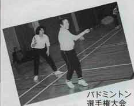
バドミントン 選手権大会