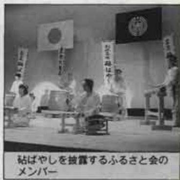
碓ばやしを披露するふるさと会のメンバー