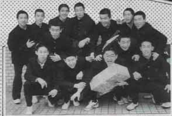
3月16日、水巻中学校卒業式のスナップです。