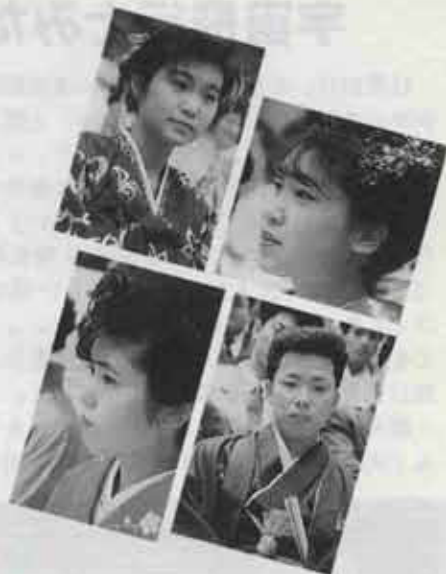
●写真は平成2年の成人式のスナップです