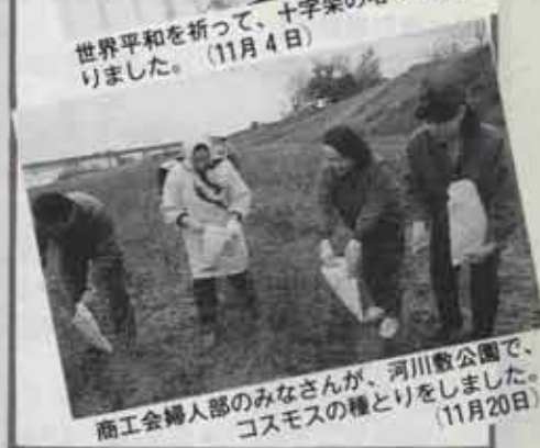
商工会婦人部のみなさんが、河川敷公園で、コスモスの種とりをしました。（11月20日）