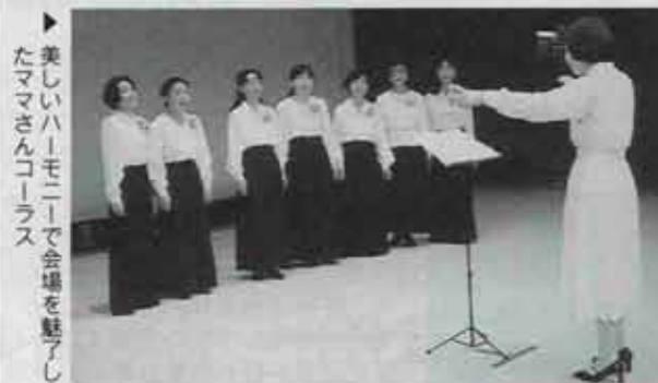
▶ 美しいハーモニイで会場を魅了したママさんコーラス