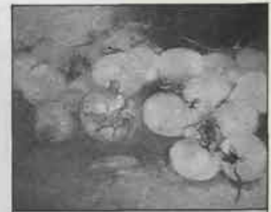
平成元年の作品「柿とザク口」

「眠れない夜は構図を考えたり色のバランスを考えたりしています。パッとひらめいた時は忘れないうちにメモするんですよ」 油絵をはじめて六年目。今までに約八十点の作品を製作してきました。絵の題材は果物、置き物、花、人形など静物が中心です。 「まだまだ勉強中の身ですが、将来は大きなキャンバスに挑戦したいですね。できたら県展にも出品してみたいです」と一言。