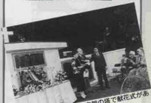
世界平和を祈って、十字架の塔で献花式がありました。（11月4日）