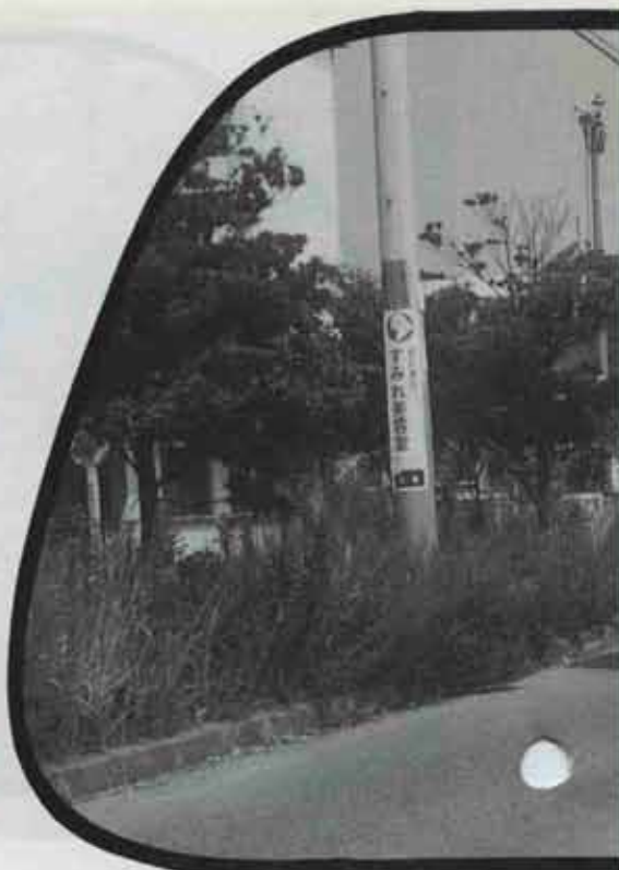
雑草が繁茂する町のメイン道路、県