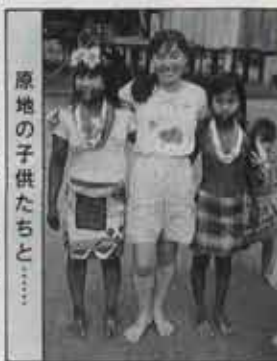
原地の子供たちと……

いる人たちが、くもの子を散らすように消えました。私はどうしたら良いかわからず、ぼう然と立ちつくすばかり」と恐怖の体験談。「事件の報道を聞いて心配しま