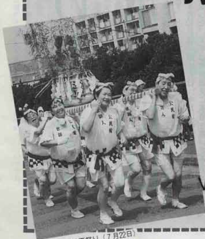
●高松団地夏祭り(7月22日)