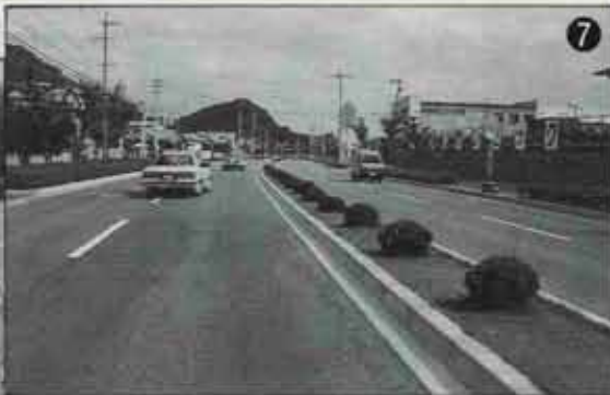
▲ 美しく整備された、八幡西区内の水巻・芦屋線（向田団地付近）