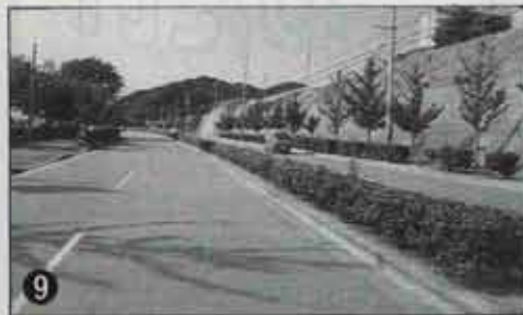
▲ 芦屋町内の県道水巻・芦屋線（江川台付近）「走りやすい」とドライバーにも好評です。