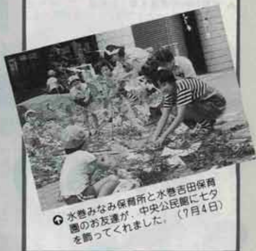
◎水巻みなみ保育園と水巻吉田保育園のお友達が、中央公民館に七夕を飾ってくれました。(7月4日)