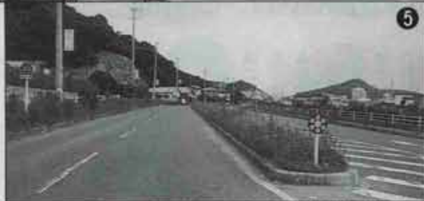
水巻町の北玄関。行政区を越えるといきなり雑草の世界が広がる。（高松下水処理場付近）