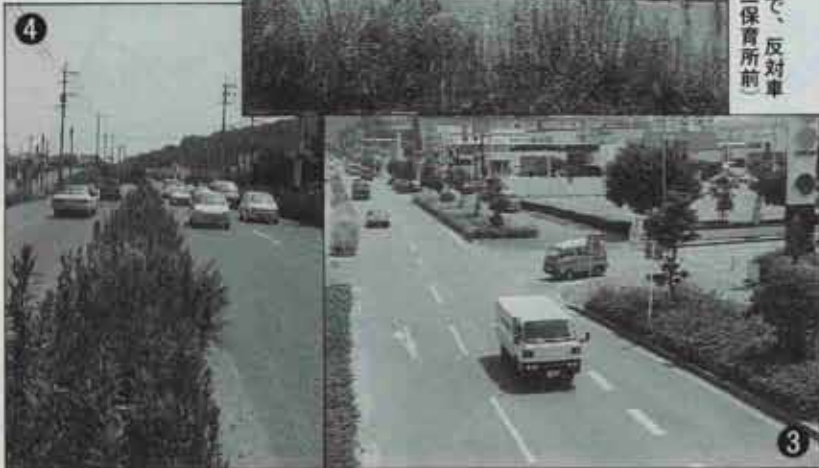
背丈ほどに伸びた雑草で、反対車線が見えません。（第三保育所前）