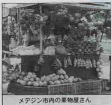
メデジン市内の果物屋さん