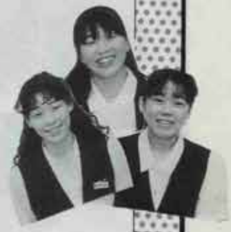
写真で見るとわがまち ④

減 量の効果を高めたもう一つの理由としては、週に二、三回のニコニコベースの水泳が大きなウエイトを占めています。四十年代になってやっと自分のしたいことができるようになった私は、思いきって長年の希望であった水泳を始めてみました。一か月もするとクロールで二十五メートルも泳げるようになり、今もマイペースで続いています。今年になって母が亡くなり三か月程休みましたが、その間は、遠賀川の河川敷を散歩し、私のニコニコベースの運動は継続できました。 こ の減量のおかげで、自分だけでなく家族を含めたバランスの良い食生活を見直すことができました。仕事や家事をしながらの運動は、なかなかできないかもしれませんが、できるだけ無理のない運動を続けることが、肥満の解消になるのではないのでしょうか。