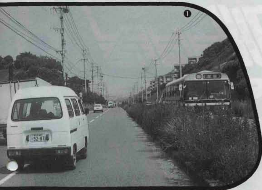
道水巻・芦屋線（梅ノ木団地付近・7月31日撮影）