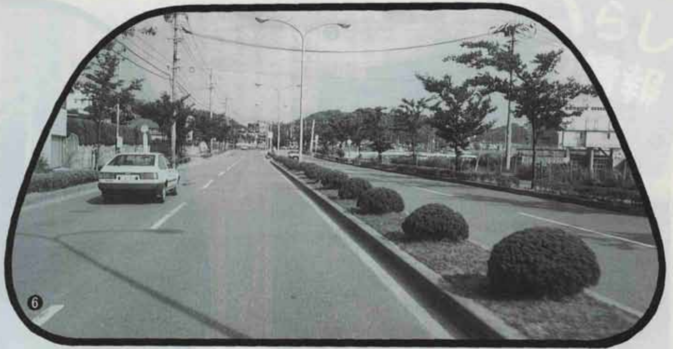
芦屋町内の県道水巻・芦屋線。中央分離帯もきちんと手入れされています。(江川台付近)