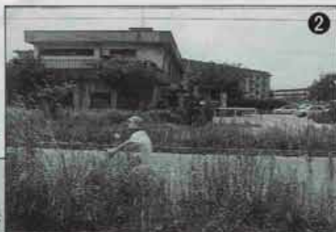
背丈ほどに伸びた雑草で、反対車線が見えません。（第三保育所前）