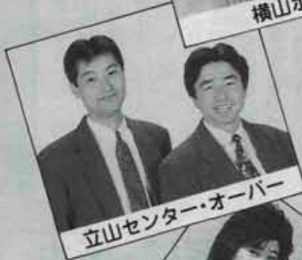
立山センター・オーバー