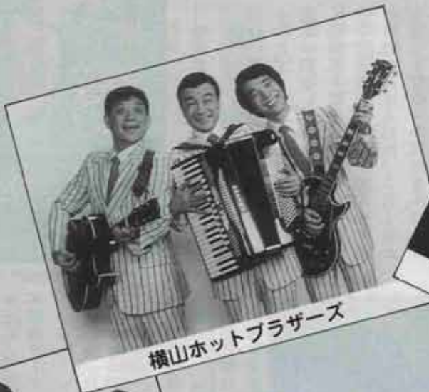
横山ホットブラザーズ