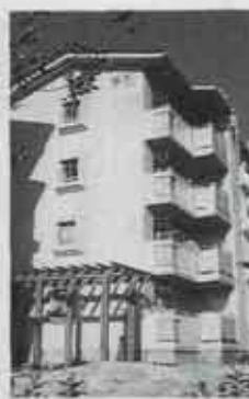
※詳しくは、役場住宅課へ。