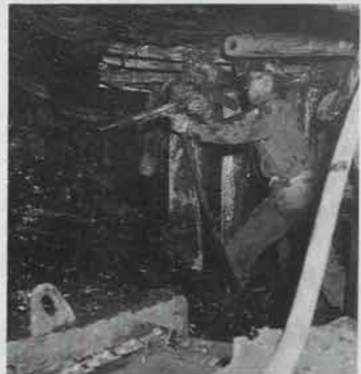
⑥ 日炭高松一砒の坑内(昭和30年代) 大屑(坑道の上)でエアピックを使ってカッベ採炭している現場