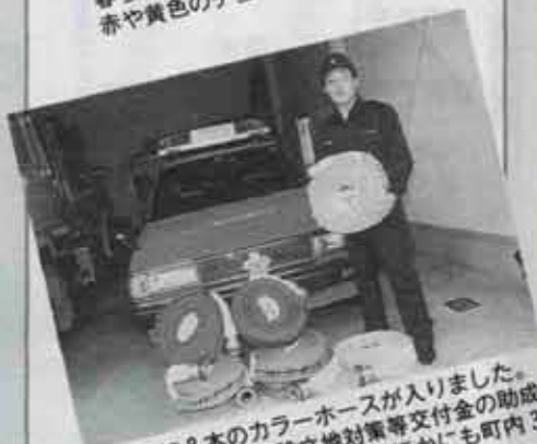
消防団に8本のカラーホースが入りました。これは石油貯蔵施設立地対策等交付金の助成を受けて購入したものです。ほかにも町内3か所に消火栓が新設されました。