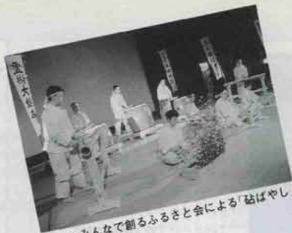
▲みんなで創るふるさと会による「粘ばやし」の演奏