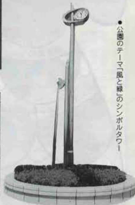
●公園のテーマ「風と緑」のシンボルタワー

●使用時間(夏期●4月～11月) 9時～21時30分 (冬期●12月～3月) 9時～17時