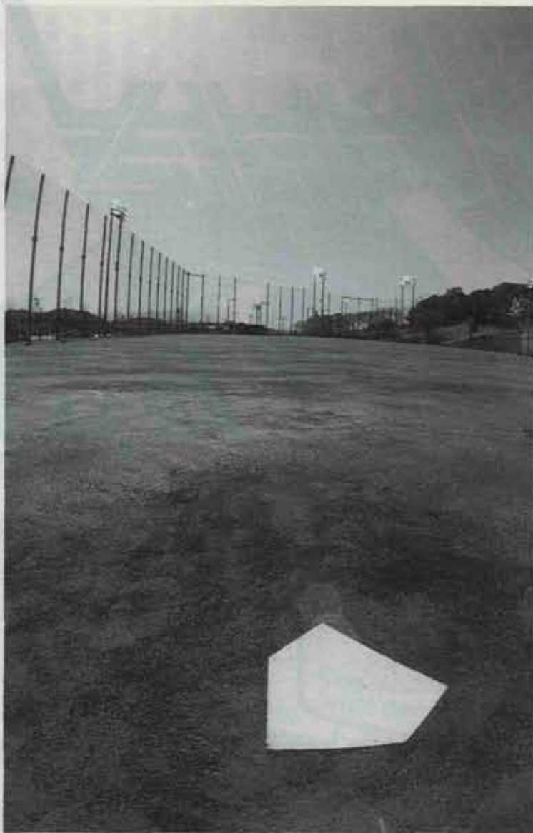
●多目的グラウンド