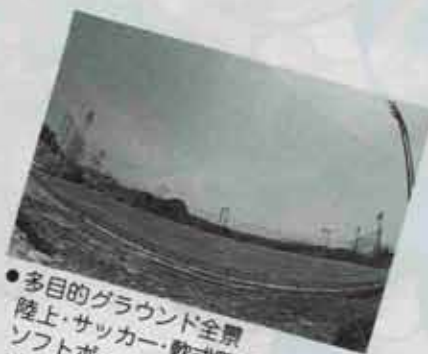
●多目的グラウンド全景 陸上・サッカー・軟式野球・ソフトボールなどに使えます。

余暇時代の幕開けとともに、働き過ぎといわれる日本人も、ようやくスポーツやレクリエーションに目を向けるようになりました。 現在町では、町の中央部にスポーツ・レクリエーションゾーンをつくるための「ふるさとエー」の整備事業に取り組んでいます。今年が多目的グラウンドとテニスコートが完成しました。