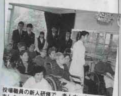
役場職員の新人研修で、老人ホームを見学しました。今年は5人採用されました。