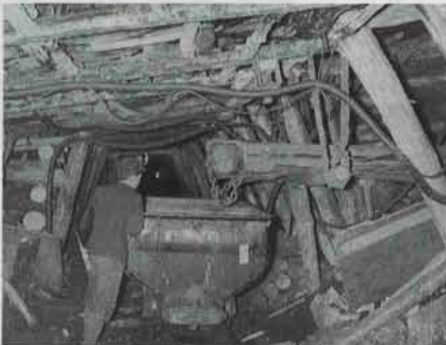
⑤ 日炭高松の二砒の坑内(昭和28年) 曲方(下側の坑道)でトラフを使って石炭を積み込む作業

(お知らせ) 5月7日から6月末まで、役場庁舎内に、昔の写真(約100枚)を展示中です。