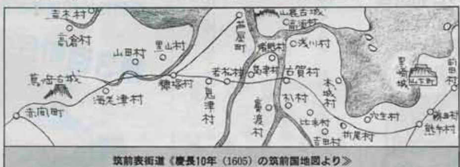
筑前表街道(慶長10年(1605)の筑前国地図より)

これより磯塚村、若松村を経て西の遠賀川を渡って島津村につき、さらにここで東の遠賀川(今の曲川の位置)を渡って古賀城下の古賀村についた。また古賀村からは山越えして折尾村に出て黒崎に至る道筋で、これを昔は筑前表街道といっていた。なかでも毛利軍にとつて、二つの遠賀川がもつとも悲惨であった。寒風のなかを泳いで渡る毛利軍を、岸で待ちうけた大友軍が真つ向から拜み打ち、死体は累々として川を鮮血で染めたのである。このとき古賀城では初め毛利軍に食糧などを与えていたが、あまりにも敗走兵が多いのと、大友からの後難を恐れて大手門は閉めたまま、これは麻生、宗像らが直ちに大友へ帰順を申し入れたことからもうかがわれる。