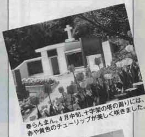
春らんまん。4月中旬、十字架の塔の周りには、赤や黄色のチューリップが美しく咲きました。