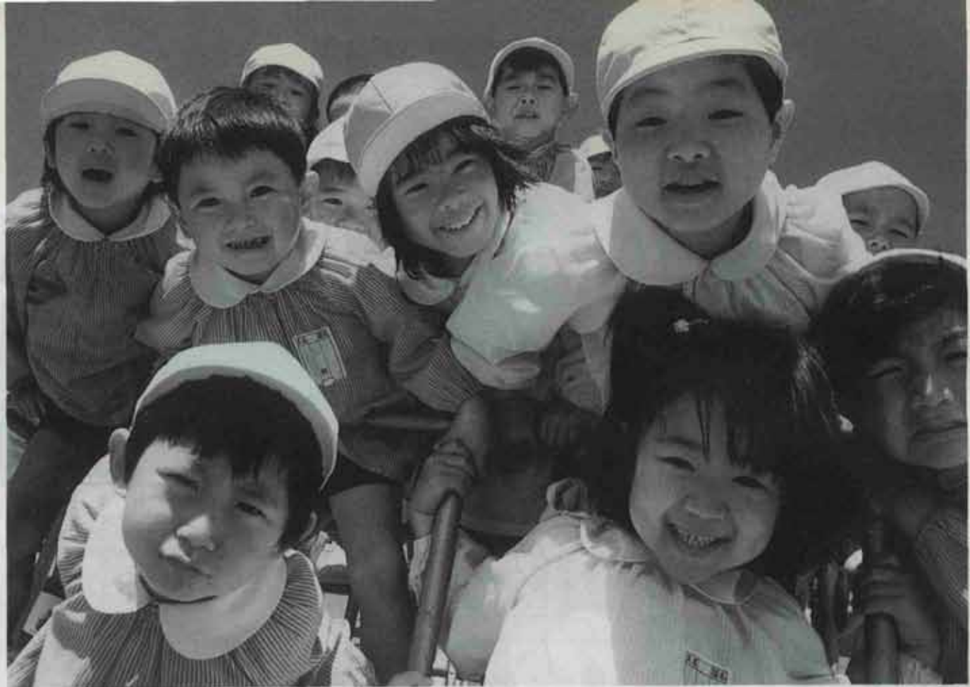
●写真は水巻北保育所