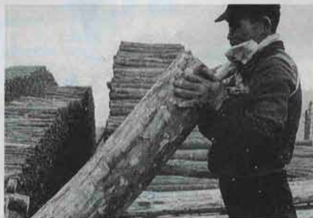
㉑ 昭和31年 坑木場で一番力持ちの作業員。手にしているのは、坑内で使う坑木です。(現吉田団地)