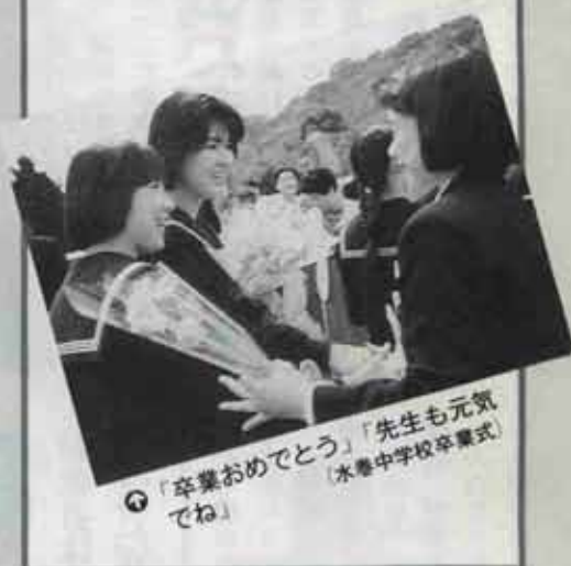
◎「卒業おめでとう」「先生も元気でね」 (水巻中学校卒業式)