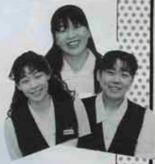
写真で見るとわがまち 37

健診のことは何でも、かかりつけの医師に相談しましょう。健診結果もきちんと報告しておきましょう。(ふ)