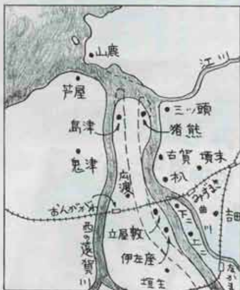
江戸初期の遠賀川河口(慶長年間の地図による)