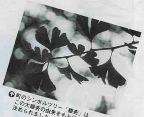
② 町のシンボルツリー「銀杏」は、この大銀杏の由来をもとに決められました。

上品な顔立ちといい、清楚な振舞いといい、その姫の美しいこと。尊はいとおしく思われ、砧姫を側に置いて身の回りの世話をさせました。