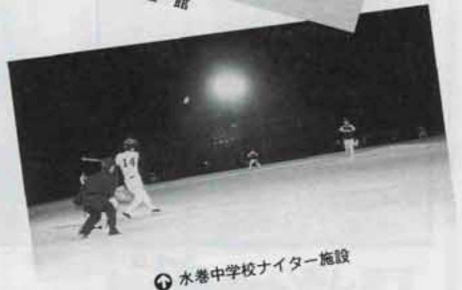
水巻中学校ナイター施設