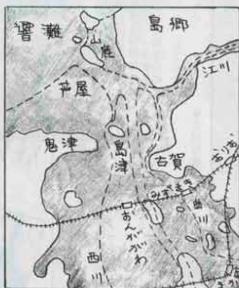
弥生時代の遠賀川河口(点線は現況)