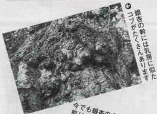
銀杏の幹には乳房に似たコブがたくさんあります