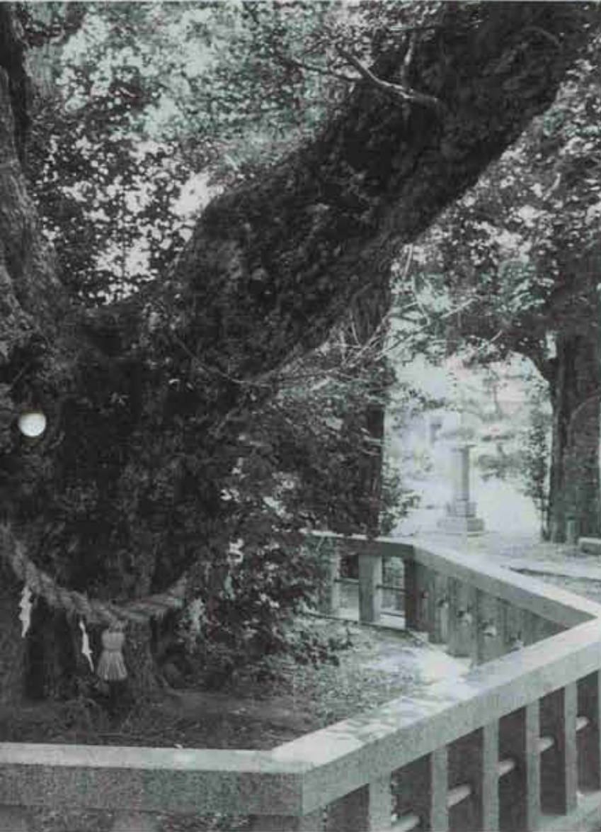
① 八剣神社の大銀杏

遠賀川のほとり、立屋敷の八剣神社の境内に、一本の大きな銀杏の木があります。樹齢約千八百年。幹の周り一〇・一メートル、高さは二二・六メートルで、昭和五十三年に県の天然記念物に指定されました。この大銀杏には、日本武尊と砧姫のロマンスが伝えられています。今月の特集は、町のシンボルツリーにまつわる「砧姫の物語」を紹介します。