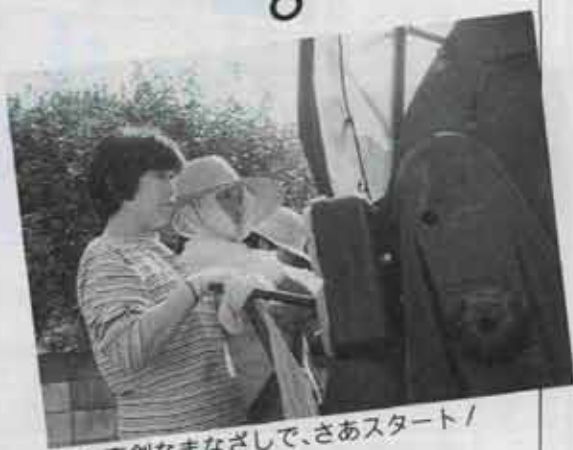
❷ 真剣なまなざしで、さあスタート！