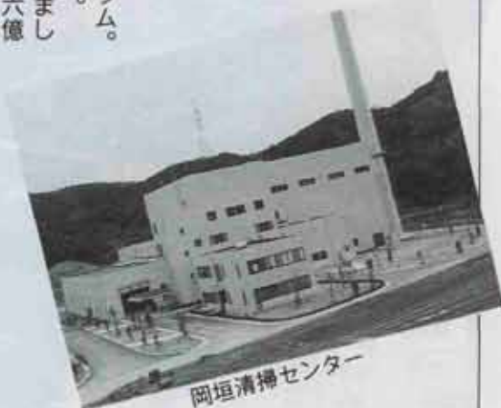
岡垣清掃センター