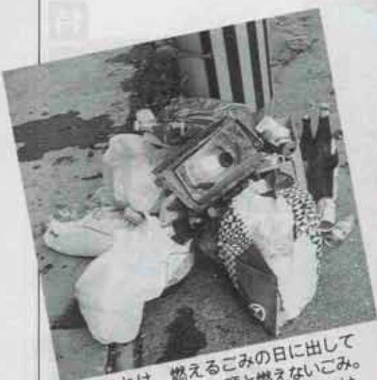
① これは、燃えるごみの日に出してあったビン・カン類と燃えないごみ。収集できず、ゴミステーションは片付きません。