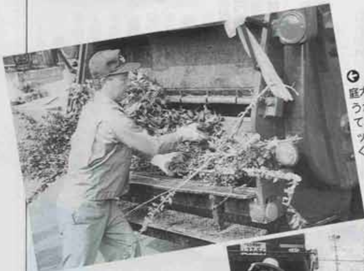
③ 庭木の手入れをしたのでしょうか。長いままの枝が出されていました。この長さではバッカー車に入りません。短く切って出して下さい。