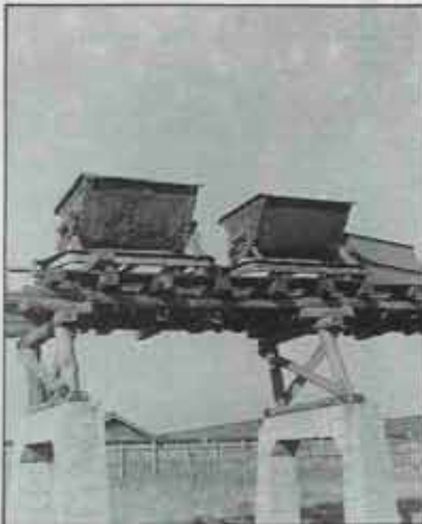
昭和29年 微粉炭車と棧橋 (現吉田団地県道側)

いずれも昭和20年代の写真です。 このころの水巻は、石炭産業の好 況に支えられて発展しました。