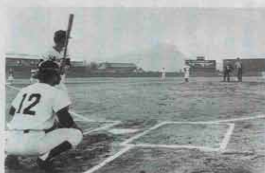
昔あった高松グラウンド（前方に見える山は豊前坊）

当時、筑豊ほどのヤマにおいても閉山撤収する際は、従業員や地域住民の要望を入れて、惜別の余韻を残しながら温かい処置をして、歴史の幕を閉じたものである。聞くところによれば明治鉱業の安川資本は、炭鉱隆盛の戦時中に買収した用地を、閉山後、もとの地主に整地までして、賃賃価格同様の値段で分譲している。また隣の大正鉱業においても、昭和三十九年、倒産同様の特別閉山をしたが、それにもかかわらず元従業員や地域行政に対して、多くの温かい遺産を残している。