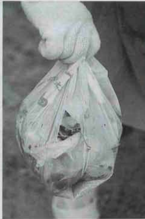
② 収集日の前日から出してあった生ごみです。猫がかじって穴があいていました。