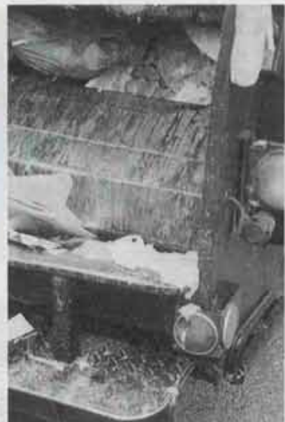
④ ダンボール箱に入れてあった残飯のカレーが、バッカー車のステップにこぼれ落ちました。