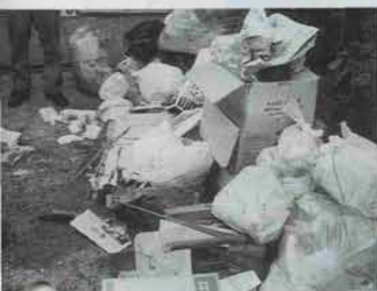
❶ ご覧ください。この有様。燃えないごみ、ビン・カン類、燃えるごみがバラバラに出してありました。

作業をしたのは六月十九日の朝八時から九時までの一時間。収集地区は吉田団地。この日は「燃えるごみ」の収集日でした。