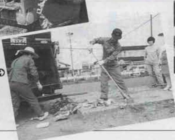
⑤ きちんと袋に詰めてないごみは、ゴミステーションを汚します。収集作業も手間どります。