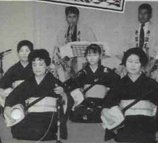
協会による三味線和洋合奏