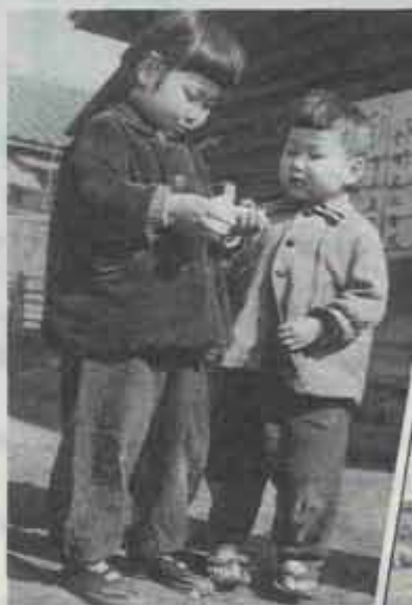
昭和29年 片山区の炭住内でお菓子を分けあうなかよし姉弟 (現吉田片山)

男の子のゲタや女の子のズック、竹かごなどが当時の暮らしを伝えてくれます。今はもう見かけなくなった光景ですね。