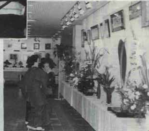
生花展や書道展など中央公民館は作品の山です