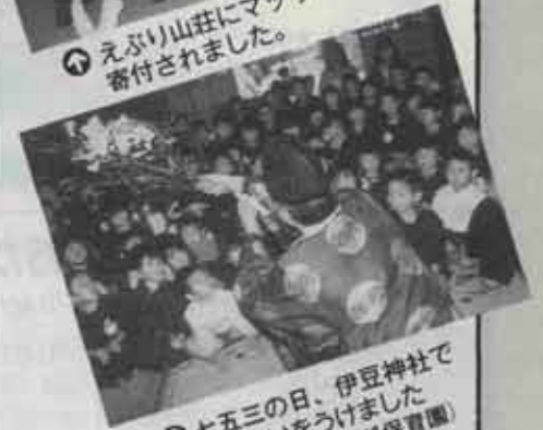
⑤ 七五三の日、伊豆神社で おはらいをうけました (第1保育園)