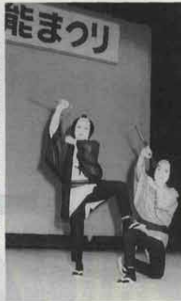
芸達者な人もたくさんおられますね

また、文化の日に催された芸能まつりは、延々十二時間にわたって多彩な芸が披露され、一日中、四百人の観客でにぎわいました。