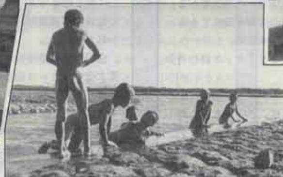
昭和31年ごろ 遠賀川の伊左座ぎきで水遊びをする子供たち