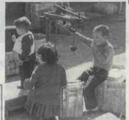
昭和32年 市場で買い物をするお母さんを待っている子ら (現吉田片山)