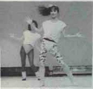
ダンスも登場した芸能祭り