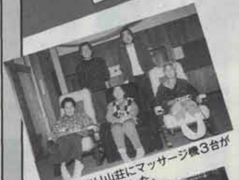
④ えぶり山荘にマッサージ機3台が 寄付されました。